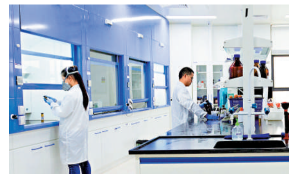
▲灣區醫藥衛生融合發展加速，圖為科研實驗室。

人獲聘澳門科技大學中醫藥學院研究生兼職導師，7人入選2022年本科專業課程授課老師。未來雙方將充分發揮澳科大「中藥質量研究國家重點實驗室」綜合科技優勢及醫院臨床資源優勢，開展科研合作；同時，發揮澳科大教學優勢，共同打造一支優質師資隊伍；共同建設臨床研究型高水平三級甲等中西醫結合醫院。