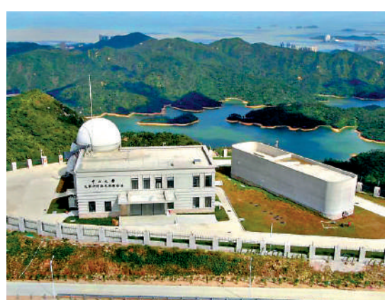
▲天琴計劃激光測距台站。

它在國際上首創地心、垂直黃道面的軌道方案。根據天琴計劃，將於2035年前後在約10萬公里高的地球軌道上，部署三顆全同衛星構成一個邊長約為17萬公里的等邊三角形星座，建成一個在太空中進行引力波探測的空間引力波天文台，開展引力波源探測。