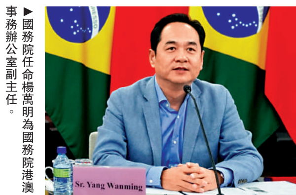
國務院任命楊萬明為國務院港澳事務辦公室副主任。

【大公報訊】國務院昨日任命國家工作人員，任命楊萬明為國務院港澳事務辦公室副主任。公開簡歷顯示，楊萬明1964年3月出生於北京，博士研究生學歷，經濟學碩士、