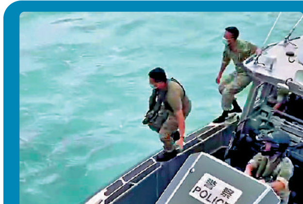
奮不顧身 ▲水警飛Sir(左)乘快艇趕到現場，立即躍進水中救人。

昨日下午水警基地通知有人在小西灣墮海，飛Sir立即駕快艇趕赴現場，當駛近少年時，他人如其名「飛」身落海救人，另一名同袍亦跳落海中支援，兩位勇警合力將少年救上快艇，急送上岸送院搶救。