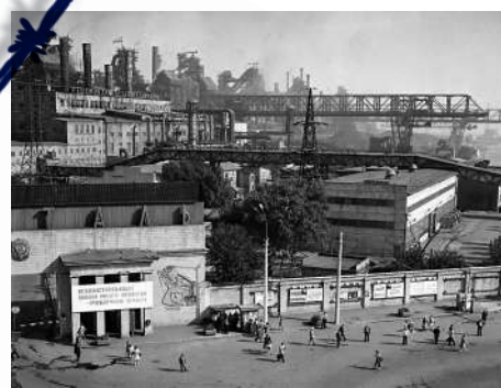
▲一九七八年，亞速鋼鐵廠入口處。