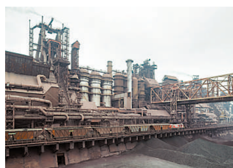
▲鋼鐵廠內的高爐和鐵路。資料圖片