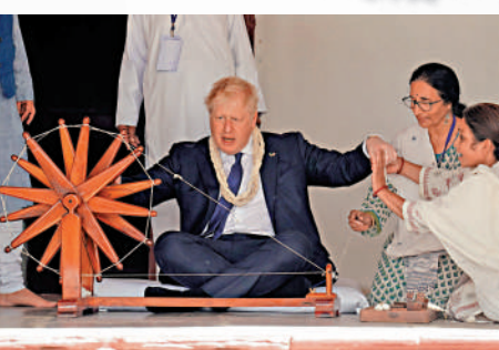
▲英國首相約翰遜21日在印度甘地靜修院紡紗。

此外，在禁運俄羅斯能源問題上，德政府內部再度出現分歧。德國外長貝爾伯克20日在訪問波羅的海三國時宣布，從明年起，德國將不再進口俄羅斯石油。德國財長林德納當晚對此予以否認，稱德國正努力終結對俄能源的依賴，不過沒那麼快，「還需要一些時間」。他認為，突然停止對俄能源的進口可能會導致德國汽車製造業等大批生產商停產。