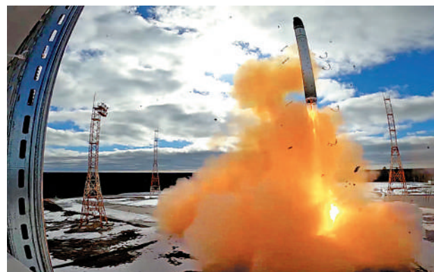
▲俄羅斯20日成功試射可攜帶核彈頭的「薩爾馬特」洲際彈道導彈。

CNN稱，俄方此時高調試射「薩爾馬特」導彈，是為了轉移外界對俄黑海艦隊旗艦「莫斯科」號沉沒的注意力，認為普京迫切需要一些「炫耀性的武器和積極的軍事新聞」來滿足俄羅斯民眾。