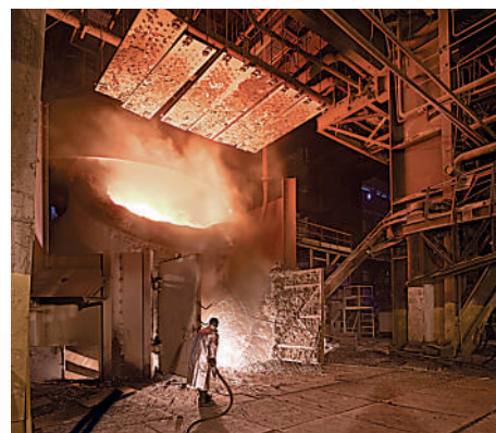
▲工人在鋼鐵廠工作。