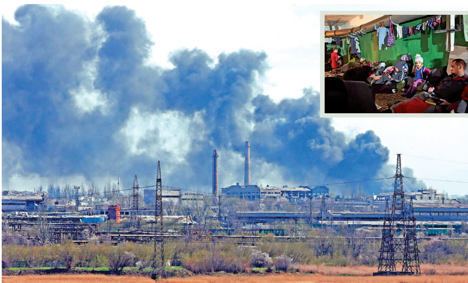
▲烏方稱，亞速鋼鐵廠內部有上千平民。