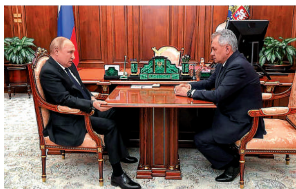
▲俄羅斯總統普京（左）21日在克宮聽取俄防長紹伊古匯報。

【大公報訊】綜合CNN、美聯社報導：俄羅斯總統普京21日在克里姆林宮會見俄國防部長紹伊古。紹伊古表示，俄軍已控制除亞速鋼鐵廠外的整個馬里烏波爾市，該市「已經解放」。普京下令俄軍取消攻打亞速鋼鐵廠的計劃，但要求俄軍繼續封鎖該鋼鐵廠，令「一隻蒼蠅也飛不過去」。另外，俄羅斯20日成功試射一枚可攜帶核彈頭的「薩爾馬特」洲際彈道導彈，威懾華府。