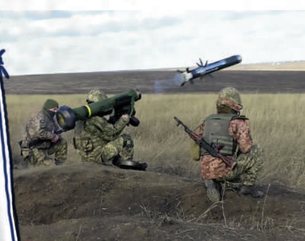
◀烏克蘭士兵使用美國提供的「標槍」反坦克導彈進行演習。

美國聯邦財政紀錄顯示，美國國會現時有47名議員及其配偶持有總計價值670萬美元的軍工企業股票。