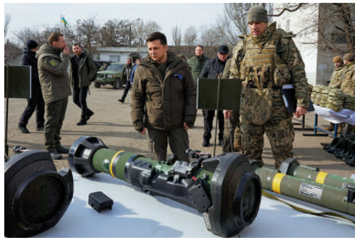
▲澤連斯基2月17日在馬里烏波爾的海岸警衛隊基地檢查武器。

根據瑞典斯德哥爾摩國際和平研究所3月發布報告稱，2017年至2021年，全球武器交易量與2012年至2016年相比下降4.6%，但同期美國對外軍售增長14%，全球佔比從32%上升至39%。過去30年該所年度報告的資深研究員魏士曼認為：「歐洲未來將是武器市場的新熱點。歐洲未來將大幅增加軍事開支，不，只是增加一點點，而是大幅增加。」