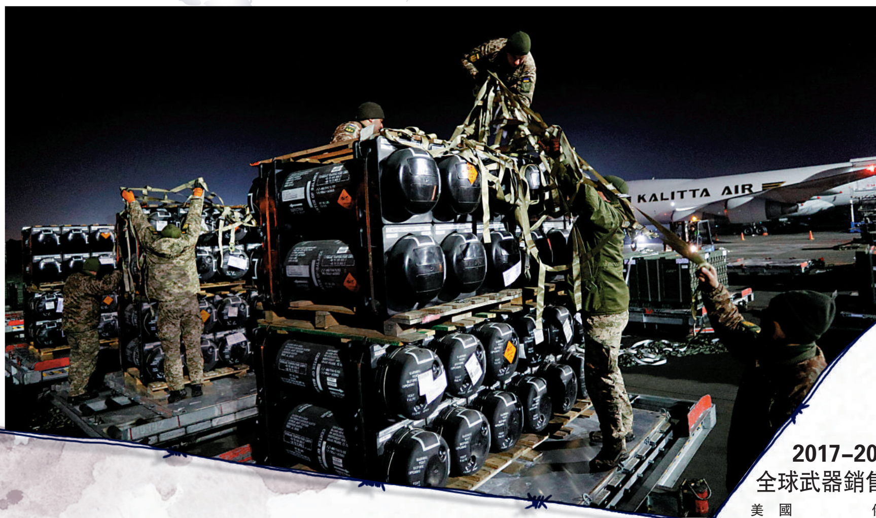
◀2月10日，烏克蘭軍人在基輔郊外的鮑里斯波爾機場卸載到達的「標槍」反坦克導彈。