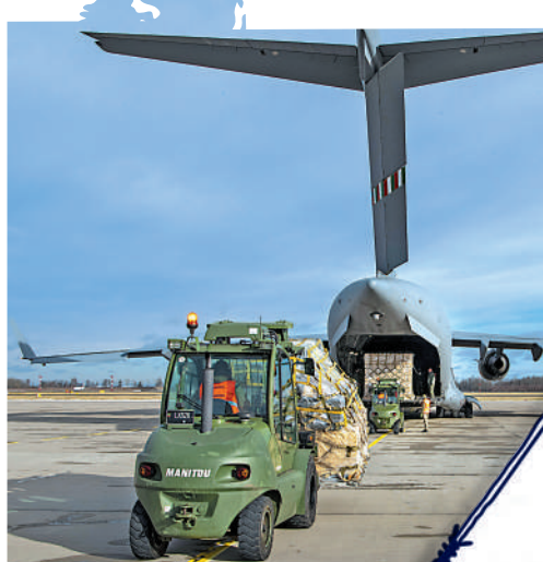
▲今年2月，立陶宛的軍人準備將美國提供的武器運往烏克蘭。