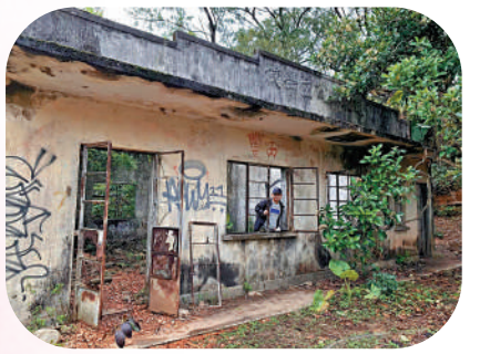
▲蓮花山公立學校課室遺址。