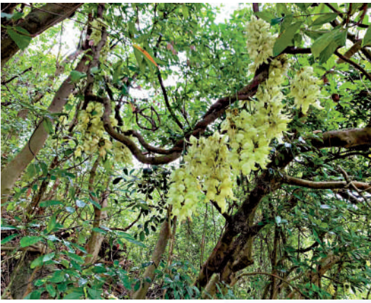
▲禾雀花懸掛於悠長盤曲的老莖上。

花如其名，禾雀花酷像頭向上尾向下的小鳥，花莖是鳥兒尖尖的喙，花瓣是頭，花萼為身，其中兩朵花瓣拱起如翅膀，形神兼備，栩栩如生，花鳥難辨。禾雀花總是一串串一掛掛，少的有七至八朵，多的有數十朵，懸掛於樹木上，如萬鳥棲枝，蔚為莊觀。陣風吹來，串串起舞，有振翅欲飛之狀。首次見到禾雀花的人，總是會發出驚嘆。禾雀花是亞熱帶植物，如果花是青白色的，學名白花油麻藤。若開紫色的花，則叫大果油麻藤，這是香港原生的品種，物稀而珍貴，早已被列為香港二級保護植物。