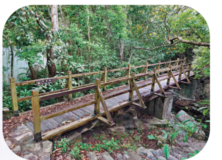
▲經田清橋和田夫仔營地前往清快塘。