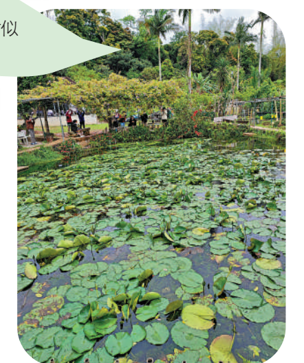
▲喜香農莊內的大型蓮花池。