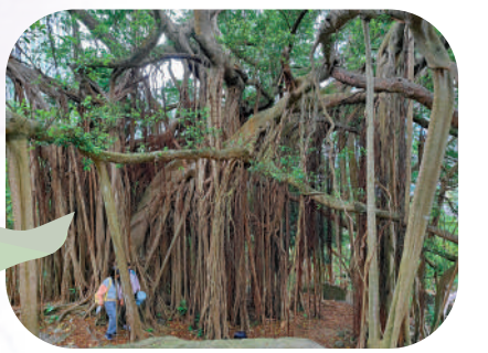
▲前往下花山的途中有一棵百年大榕樹，根枝相連。