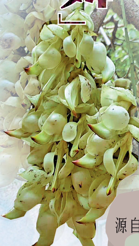
▲青白色的禾雀花，學名白花油麻藤。

此程終點是深井，經過數小時跋涉，累了餓了倦了很正常。何以醫肚？空氣中瀰漫着燒鵝的香味，刺激你的味蕾，牽引你的腳步。深井有全港最馳名的燒鵝，且有多家可供選擇，大快朵頤。美景佐以美食，看花也看美人，不虛此行。