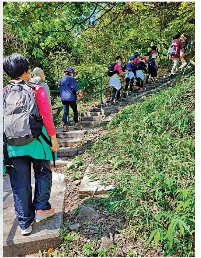
▲清明前後，禾雀花盛開，每天都有市民前往觀賞。