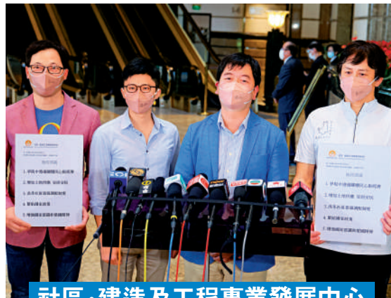
社區·建造及工程專業發展中心