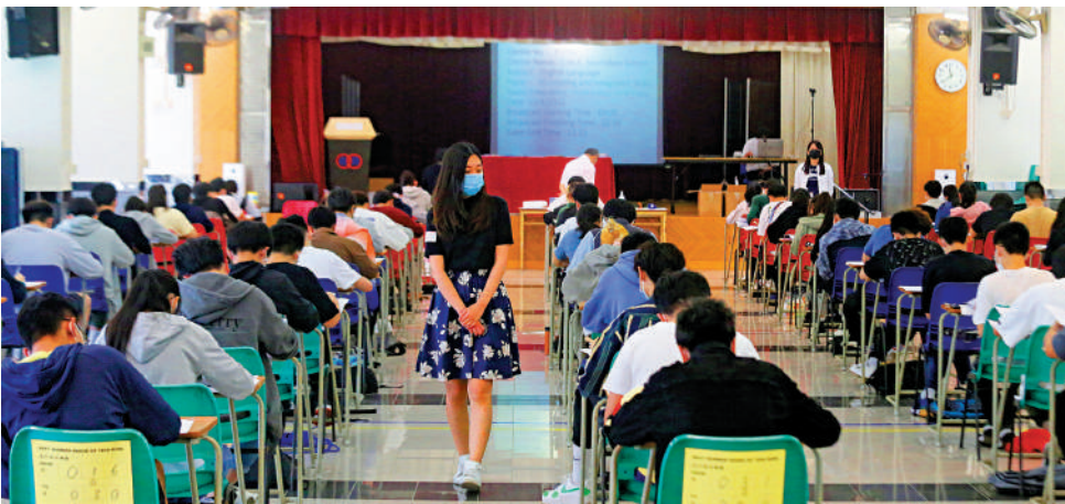
▲中學文憑試英文科卷三聆聽及綜合能力考核昨日舉行。