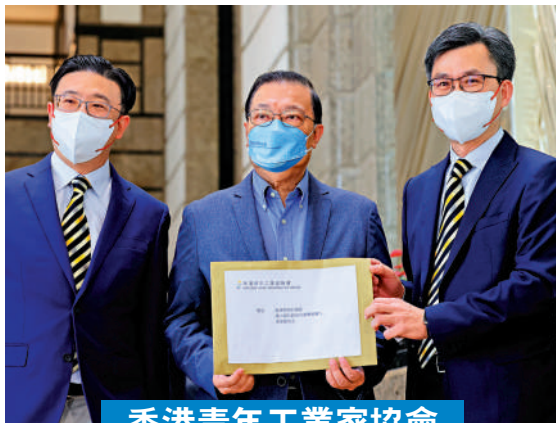
香港青年工業家協會