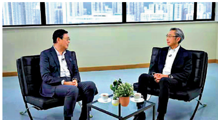
▲馬時亨（左）在電視清談節目《馬時亨名人堂》中，勉勵港人堅持夢想和堅持。

黃子欣認為，未來不少工種都會被人工智能取代，因此人們應更加認識和了解科技，定必要「創新」才不會被淘汰。