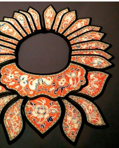
▶ 蝙蝠、蝴蝶與花卉組成的精巧彩繡。

日子有多長，光彩就有多長。提振粵劇是白雪仙一生志業，她奉獻給粵劇，粵劇也成就了她。四月初一是生辰好日子，謹祝她仙壽恆昌！