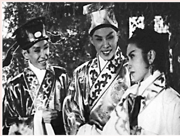
▲一九五六年粵劇電影《杜十娘怒沉百寶箱》由白雪仙、新馬師曾、任劍輝主演。

她少負志氣，「會當凌絕頂」乃一生追求，成就之高實在無法以短短篇幅來論述，燕文只是憑一點靈感，集中討論她在舞台跟電影所演過的角色而已。根據網上資料，自一九四七年起白雪仙已勤勞於水銀燈下，與馮峰合演《晨妻暮嫂》初挑大樑，一九六八年自資拍攝《李後主》是壓卷之作。廿年間共拍了約二百部戲，其中有古裝片珠捲銀動、民初片鳳仙裝束、時裝片摩登打扮，今古紅妝委實演出不少了。粗略說說，中國四大美人中演過兩位——《呂布戲貂蟬》、《西施》。文學名著及民間故事中的佳人，則有《金玉奴棒打薄情郎》、《生紅娘三戲張君瑞》、《司馬挑簾婦心》（演卓文君）、《陳姑追舟》、《紅拂女私奔》、《杜十娘怒沉百寶箱》、《唐伯虎點秋香》、《紫釵記》、《帝女花》、《獅吼記》（演陳季常之妻）、《蝶影紅梨記》、《跨鳳乘龍》（演秦穆公之女）、《芸娘》、《李後主》（演小周后）等，未拍為電影的舞台演出有《牡丹亭驚夢》、《再世紅梅記》。