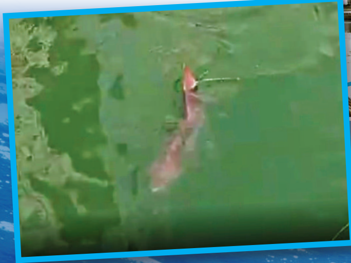
▲屯門河昨晨出現大魚游弋，魚鰭露出水面一度被誤為鯊魚。

屯門河水面昨日驚現大魚游弋，魚鰭露出水面，一度被誤以為是鯊魚，經魚類專家查證後，相信是一條身長約2.5米的翻車魚。該種魚一般在海水水深100至200米處棲息，疑因迷途誤闖屯門河道，至下午已失去蹤影，不少市民期望牠能平安重返大海。 《大公報》昨日委託專家透過水底攝錄機查探屯門河的水底世界，結果發現垃圾滿布，水質渾濁。專家分析認為，若該條大魚困在河道內，恐怕凶多吉少。 大公報記者 賴振雄