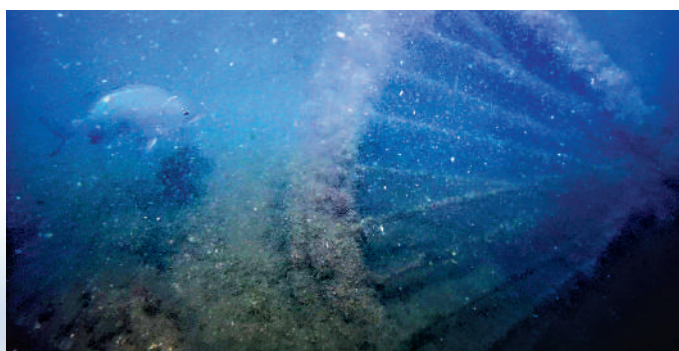
▲《大公報》委託專家利用潛水攝錄機了解屯門河底情況，發現河底滿布大型垃圾，水質渾濁，只有小魚出沒。