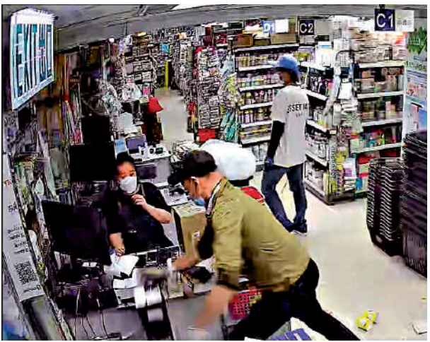
▲母嬰用品店CCTV片段顯示兩人在店內搗亂。