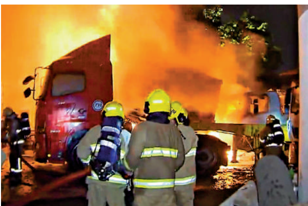
▲葵涌貨櫃碼頭昨日凌晨懷疑有人縱火，多輛貨車焚毀。