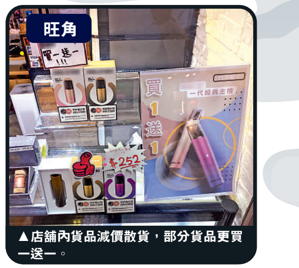
▲店舖內貨品減價散貨，部分貨品更買一送一。