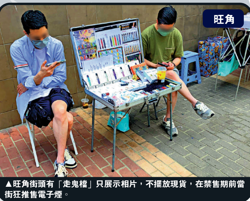
▲旺角街頭有「走鬼檔」只展示相片，不擺放現貨，在禁售期前當街狂推售電子煙。