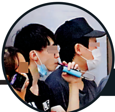
▲時下不少青少年吸食電子煙，誤以為不易上癮。

現時全港約有20萬人吸食電子煙。由本週六(30日)起，本港將全面禁售及禁宣傳電子煙、加熱煙等另類吸煙產品。大公報記者近日巡訪多區售賣電子煙的熱門商場，發現多間店舖出「怪招」散貨，包括「買一送一」促銷、在街邊擺「走鬼檔」，以及聲稱轉做線上交易，引誘煙民幫襯。 記者目擊有青少年於「死線」前急忙補貨，大手購買20個「煙蛋」。 大公報記者 盛德文、黃山、蘇榮(文)