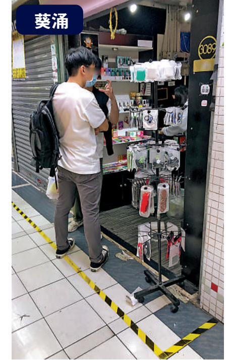
▲有青少年一口氣買了20個煙蛋，稱怕稍後無得買。

「走鬼檔」鬼祟睇相選購 有加熱煙店主表示，近月加熱煙機銷量急增三倍，更多人到店舖查詢和購買，平均每人買2至3支，有顧客甚至大批購入15支，他的店舖本月中旬已售罄所有存貨。記者連日走訪旺角、筲箕灣、銅鑼灣及灣仔區的多個