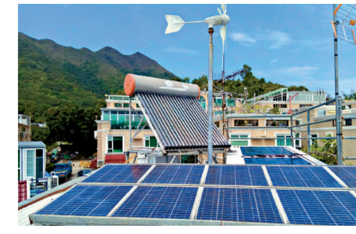
▲近年太陽能板價格下調，政府宣布即日起下調上網電價，每度電回購價減至2.5元至4元。