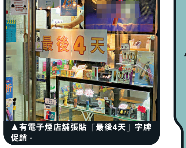
▲有電子煙店舖張貼「最後4天」字牌促銷。