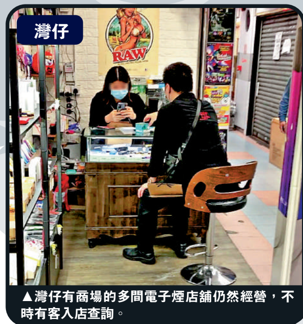
▲灣仔商場的多間電子煙店舖仍然經營，不時有客人入店查詢。

青少年豪買20「煙蛋」 隔岸的港島灣仔「188商場」內，仍有多間店舖大賣電子煙，商場一樓有四間，二樓一間。這些店舖都在櫥窗大字標明存貨有限，還有吸食工具售賣，不時有客人入店查詢購買電子煙。 至於新界的葵涌廣場內，有兩店舖仍有售賣另類吸煙產品，其中一間電子煙店舖仍有不少存貨，不少顧客選購。記者目睹兩名青少年進入店舖，其中一人一口氣買了20個「煙蛋」，更向同伴說「買就趁手，要快喇，遲啲會冇得買」。