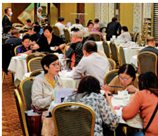
▲政府預計會按計劃在5月下旬實施第二階段放寬社交距離措施。

林鄭月娥並稱，計劃下月將九間社區隔離設施酒店轉為指定檢疫酒店，涉及逾3000個房間。政府早前已先後將約20間本來用作隔離設施的酒店，轉為檢疫酒店，並已把部分酒店交予社會福利署和醫院管理局作閉環管理，予其員工入住。她稱當