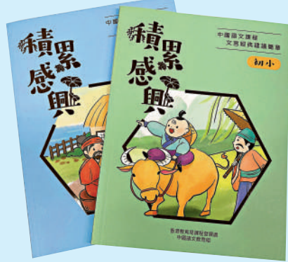
▲《積累感興——中國語文課程文言經典建議篇章》書冊，分為初小篇和高小篇。

【大公報訊】實習記者柯穎敏報道：為推廣文學文化的學習，教育局昨日表示，將於四月底至五月初陸續向全港小學分發《積累感興——中國語文課程文言經典建議篇章》書冊，以培養學生對文言經典的興趣。