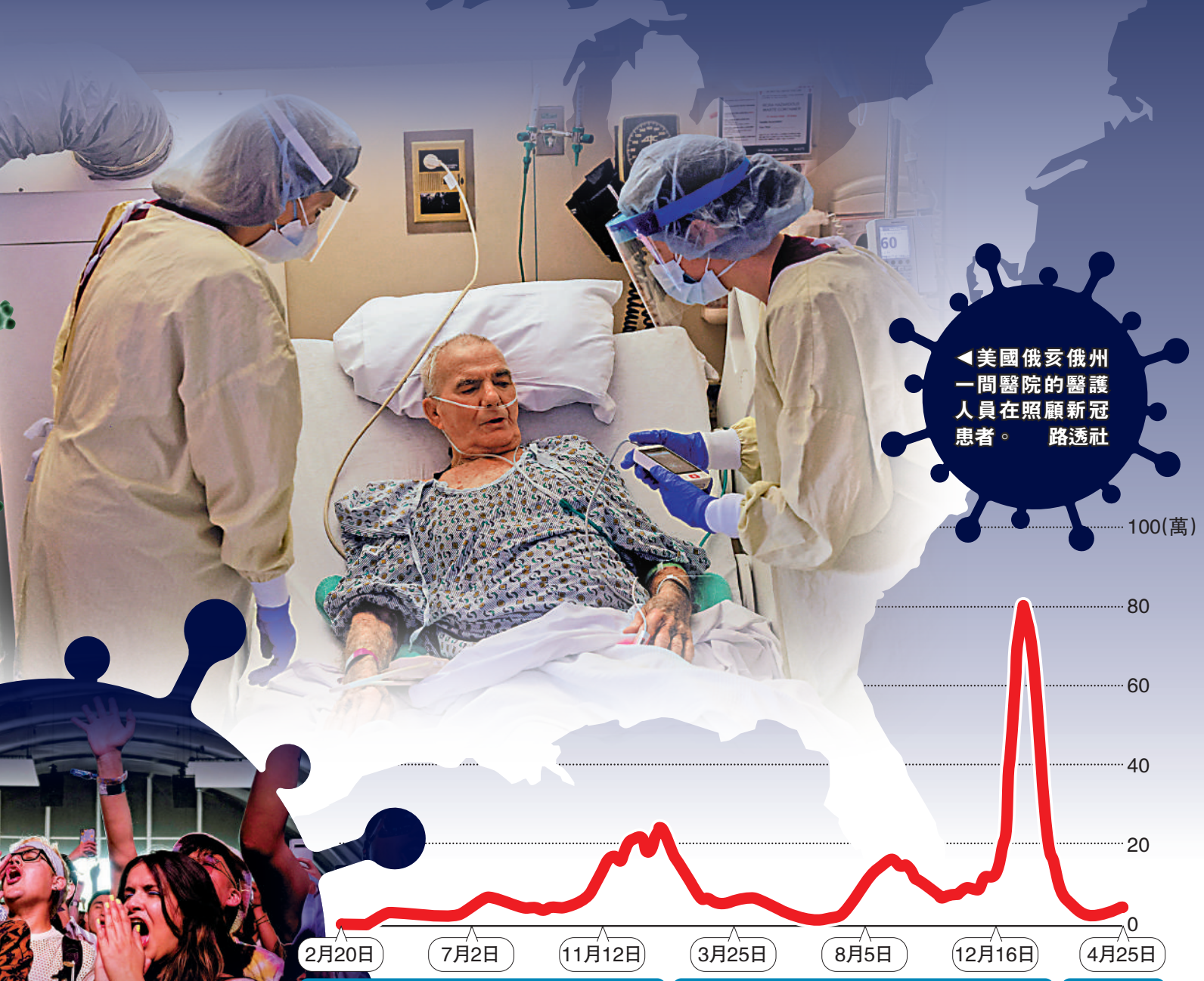
▲美國俄亥俄州一間醫院的醫護人員在照顧新冠患者。