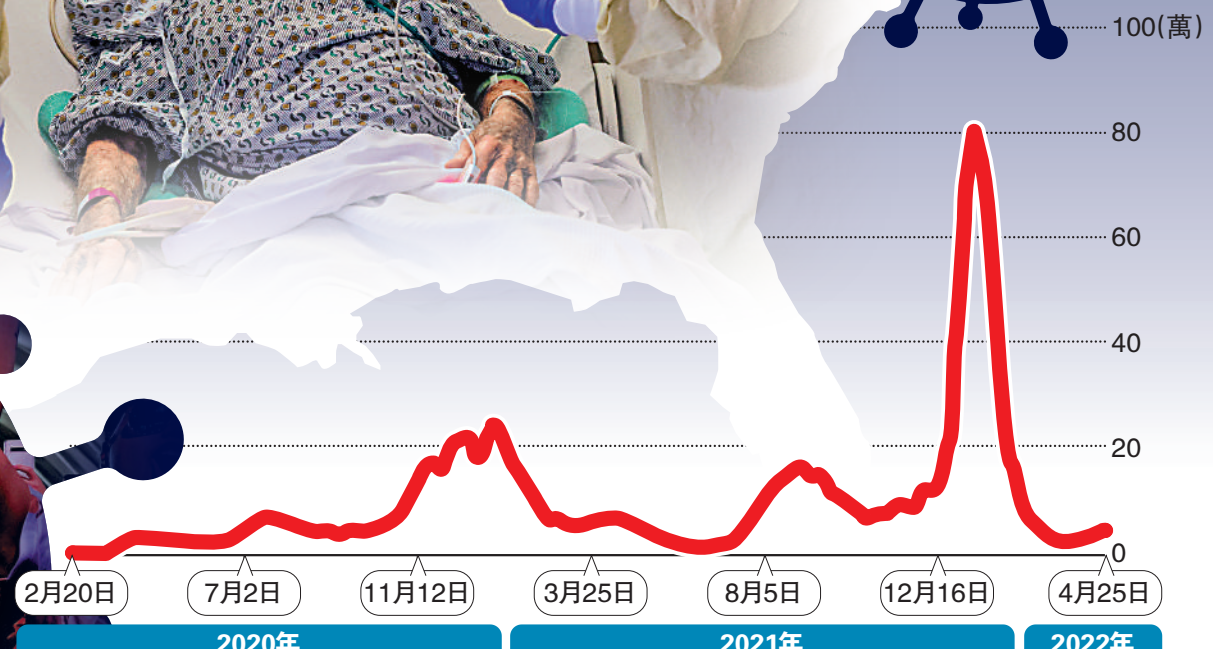
美國公開的單日染疫人數走勢*