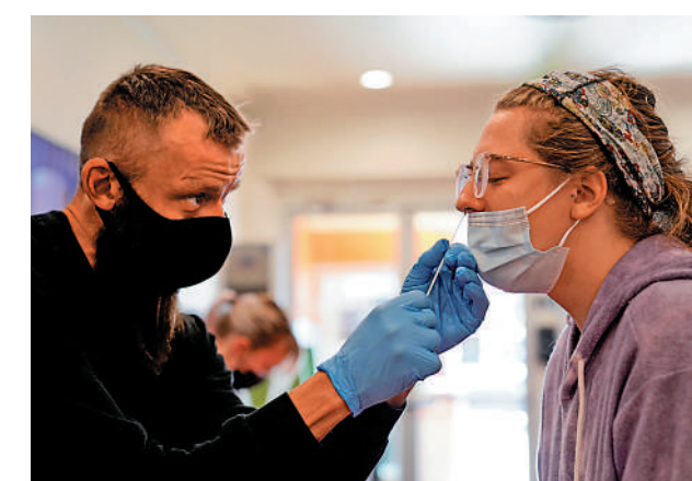
▲美國俄亥俄州馬州民眾接受新冠檢測。