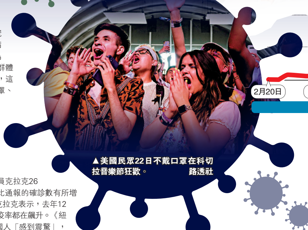
▲美國民眾22日不戴口罩在科切拉音樂節狂歡。