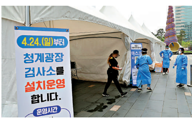
▲首爾民眾24日在臨時診所等待進行新冠檢測。

據統計，韓國2月死亡人數同比增加22.7%，為1983年開始相關統計以來的單月最高水平。韓國統計廳認為，受人口老齡化影響，死亡人數呈現上升的趨勢。加上2月份是冬季，Omicron變種病毒急劇擴散，疫情給高齡人的健康構成直接或間接威脅。