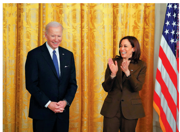
▲美國副總統哈里斯（右）26日確診新冠。

美國副總統哈里斯26日確診新冠，她將進行隔離，在副總統官邸中處理工作。艾倫稱，由於工作行程安排，哈里斯與美國總統拜登及其夫人最近沒有過密切接觸。白宮發言人普薩基表示，拜登最後一次新冠檢測是在25日，結果呈陰性。哈里斯上周在加州待了整整一周。