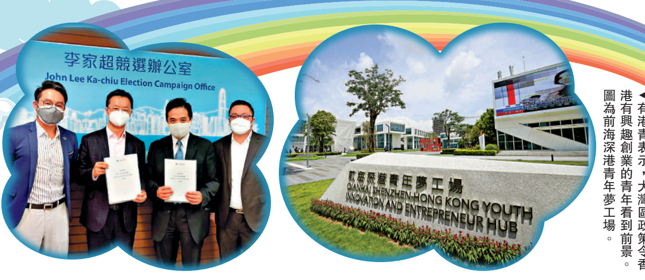
▲有港青表示，大灣區政策令香港有與興趣創業的青年看到前景。圖為前海深港青年夢工場。

關愛基層青年，推動青年團體、社福機構、公益慈善團體成立支援基金和支援機構，為基層青年提供學業、就業、居住、防疫抗疫等方面支援。 提升青年的政治參與度，增加他們在香港管治體系中的聲音。 制訂整體的長遠青年政策和發展藍圖，為青年發展設定不同政策目標。 大公報記者 龔學鳴整理