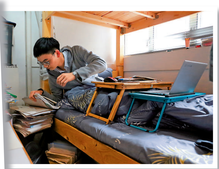
▲有關注基層學生的社區組織表示，在疫情下，社會貧富學習距離被再次擴大。