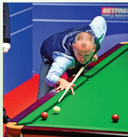
▲威廉斯第7次打進世錦賽4強。

擁有4個世錦賽冠軍的「蘇格蘭巫師」希堅斯，戰滿25局才險勝尚無一個排名賽冠軍的英格蘭球手利索斯基。