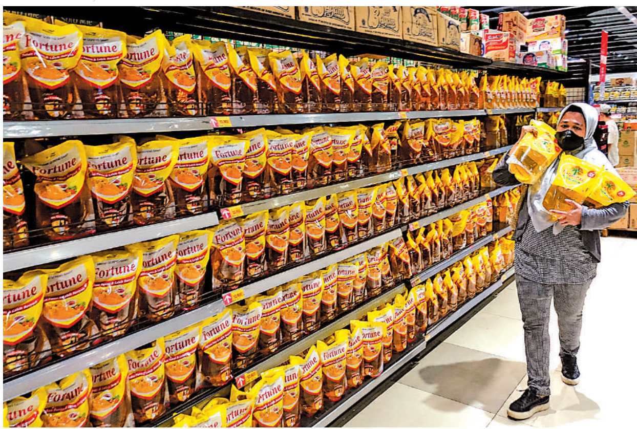
▲3月27日，印尼雅加達民眾在超市購買棕櫚油。