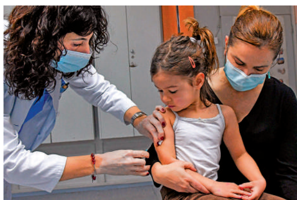
▲黑山醫療人員為民眾接種麻疹疫苗。

歐盟執委會日前表示，估計歐盟約77%的人口已感染過新冠病毒，人數多達3.5億。歐盟執委會主席馮德萊恩表示，防疫不能鬆懈，必須進一步拉高疫苗接種率及進行針對性篩檢。