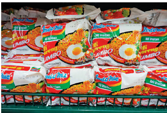
▲棕櫚油是營多撈麵的原材料之一。

印尼是世界最大的棕櫚油生產國，佔2021年全球棕櫚油出口量的56%，禁令公布後，棕櫚油期貨價格上漲近7%。棕櫚油因價格便宜又耐炸，被廣泛用於餅乾、即食麵等需要油炸的食品上，冰淇淋、洗滌劑及化妝品等也都常用到，印尼人最愛吃的營多撈麵就需要使用棕櫚油製作。