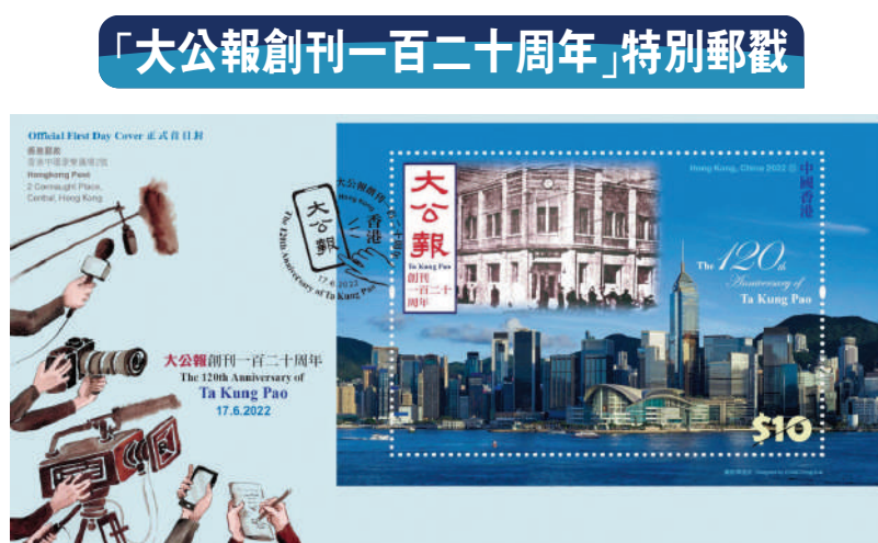
▲香港郵政專門設計一款「大公報創刊一百二十周年」特別郵票。

時傳遞國家聲音，團結凝聚香港社會各界，支持特區政府依法施政，忠實記錄和推動「一國兩制」成功實踐，為香港的繁榮穩定作出了積極貢獻。