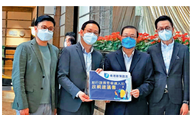
▲九龍東潮人聯會期望新一屆政府妥善管控疫情，實現有序通關。