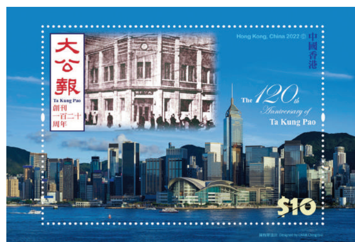
▲小型張的上下兩半分別展示昔日天津法租界《大公報》館址及今日香港的城市風光，突顯《大公報》的悠久歷史。

《大公報》1902年6月17日創刊於天津，是全球現存歷史最悠久的中文報章。在120年的風雨歷程中，《大公報》秉承「忘己之為大，無私之謂公」的精神，始終與民族同呼吸，與國家共命運。上世紀八九十年代，《大公報》為香港的平穩過渡、順利回歸祖國發揮了重要的輿論先導作用；香港回歸25年來，《大公報》立足香港，背靠祖國，面向世界，及