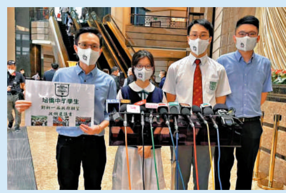
▲培僑中學學生代表向李家超競選辦遞交政綱建議書，並邀請李家超到校與學生對話交流。

生涯規劃方面，學生們希望新屆政府能夠投放更多資源在選科環節，讓學生對未來發展方向有更清晰認知；同時增加大灣區諮詢宣傳與交流互動，令港青了解並產生憧憬。此外，他們亦尋求多元出路，希望增強跨學科合作、鼓勵本港藝術發展，為創新科技人才設立大學通道，支持本地互聯網產業發展等，通過各種途徑拓寬青年就業機遇。