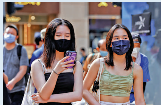
▲天文台昨日發出今年首個酷熱天氣警告,街上市民多穿上短袖衫甚至背心。

民間諺語有云:「未食五月糶,寒衣勿收櫃」,意謂未到端午節,天氣仍有可能轉涼。不過,全球氣候暖化,香港變得愈來愈熱,市民可能會更加左右為難,因為昨日酷熱天氣警告完,下周一又預計降溫到最低19°C。