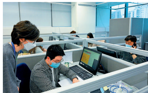
▲都會大學學生疫下成立熱線中心,為抗疫出力。

【大公報訊】都會大學自3月28日成立熱線中心,協助醫院管理局接聽和跟進患者查詢,至今已處理2250宗個案。都大透露,護理系師生將於6月主動聯絡未接種疫苗的長者和行動不便者,安排登記上門接種。