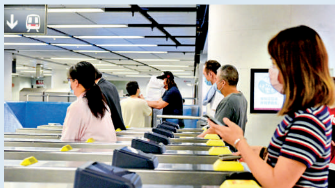
▲由明日起交通補貼的申領門檻由400元降低至200元,每月補貼上限亦由400元提高至500元。