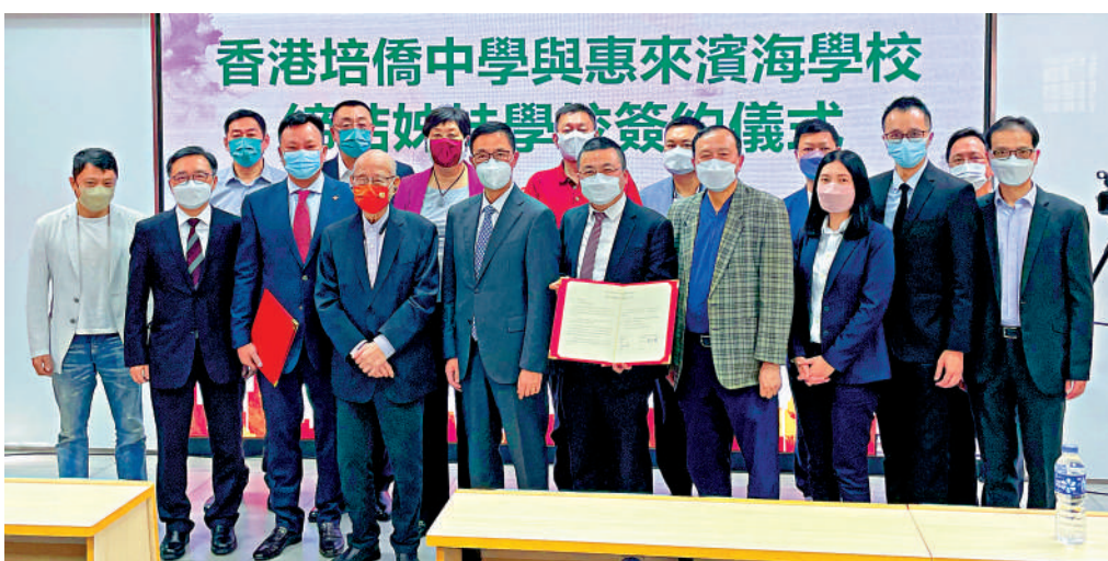
▲培僑中學與惠來濱海學校締結姊妹學校,昨日透過網上視頻方式舉行簽約儀式。

簽約儀式由中聯辦教科部部長蔣建湘及特區政府教育局局長楊潤雄主禮,由培僑中學校長伍煥杰及惠來濱海學校校董會主席黃少賢簽署協議書。蔣建湘表示,香港回歸後,有近2000對學校締結為姊妹學校,其中廣東省藉地緣優勢,超過1000對兩地姊妹學校舉辦大量的交流和聯誼活動。蔣建湘說,之所以用「姊妹」相稱,就是希望像家庭同胞一樣關係密切,「希望兩校合作善用辦學資源優勢,實現互補