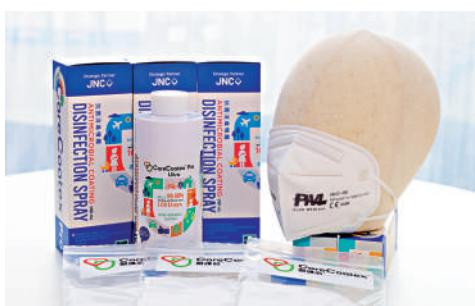
▲佳昇研發的CareCoatex™ Pro Ultra天然抗菌抗病毒塗層,及與合作夥伴製備的CareCoatex™天然抗病毒FFP2立體防護口罩。

李蓓和林峰均對理大表示感謝,他們還透露佳昇科技疫下與合作夥伴製備CareCoatex™天然抗病毒FFP2立體防護口罩,現時已於上海使用,將陸續推出其他市場。