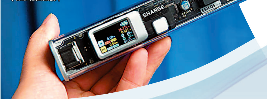
▼閃極130W超級移動電源 (銀翼探索版)。

最近閃極還與手機廠商魅族合作推出了一款支持130W超級快充的透明移動電源。這款產品配備了高分辨率IPS彩屏，可以顯示實時電壓、溫度、電流、功率等信息。它內置鋁合金框架，搭載21700鎳電芯，容量20000mAh。提供了一個USB-C口以及一個USB-A口，兼容PD、PPS、QC3.0、PE2.0、AFC、FCP、SCP等快充協議。綜合技術、用料還有外觀設計，閃極的這款透明充電寶可謂是目前移動電源產品的「天花板」(形容程度非常高) 級別的作品。