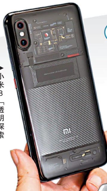
►小米8「透明探索版」牢牢抓住了科技發燒友的需求。

追求科技感和透明之美也是很多遊戲愛好者的一大特點。因此，前不久，努比亞在新推出的遊戲手機紅魔7 Pro上，也推出了透明版。它的背殼中間區域採用金屬雕刻的工藝，結合環繞式擴散紋理，四周逐漸透明，一側若隱若現的露出標誌性的「氣」字logo，另一側的背殼下則隱藏了一顆遊戲玩家喜愛的炫彩RGB環形燈。很多遊戲玩家習慣在玩遊戲