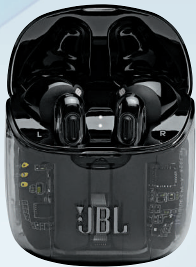
▲JBL Tune 225TWS藍牙耳機採用了半透明材質設計。

在真無線藍牙耳機風行的當下，市場上不同品牌的產品過於受到蘋果AirPods產品的影響，出現了很多外觀同質化的現象。此時，JBL則發覺了大家對於個性追求的需要，推出了JBL Tune 225TWS透明真無線藍牙耳機。它從耳機本身到充電盒均摒棄了傳統材質，採用了半透明材質設計，可以清晰的看到耳機和充電盒內部精密的電路系統，給人以一種未來科技的感覺。為了進一步突出個性，它還推出了黑色和亮橙色兩種透明版。