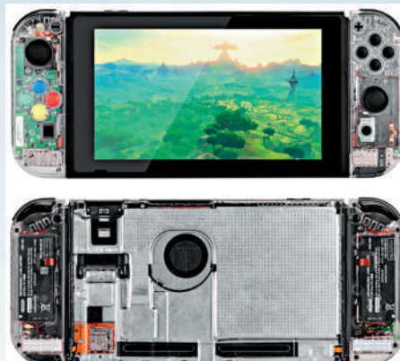
▼第三方推出的Switch透明外殼和配件。