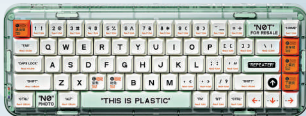
▲MeiGeek三模透明客製化機械鍵盤。

市場上有很多透明殼體和透明鍵帽的機械鍵盤。因為透明的鍵盤更具科技感，可以讓我們在工作的時候減少枯燥的感覺，所以受到很多職場人的喜愛。今次介紹一款來自MeiGeek的三模透明客製化機械鍵盤Mojo68。它採用淺藍色透明殼體，安裝上定製白黃搭配的鍵帽，當鍵盤的背光從鍵帽的間隙和鍵盤的透明殼體間散發出來時，那種晶瑩剔透的感覺，就像水晶一樣美妙。