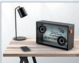
▲MORROR ART懸浮歌詞字幕音箱。

在音箱界，還有一款深受發燒友喜愛的透明音箱。那就是MORROR ART懸浮歌詞字幕音箱。遠遠看着它，很難將它與音箱聯繫在一起，有人說它遠看就像一個透明魚缸。它的特色除了不錯的音質外，就要數它機身這款全透明的顯示屏幕了。在播放音樂的同時，這塊透明的顯示屏上會同步以藝術字體展示這首歌的歌詞。因為它別出心裁的採用了前後透明的顯示屏幕，當歌詞出現時，會給人以一種歌詞懸浮在空中的錯覺。我們還可以通過專屬的App，對歌詞展示的字體、特效等進行設置。雖然它是一塊透明的屏幕，但也可以通過App連接從而顯示彩色的圖片，增加了可玩性。