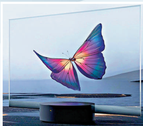
▲小米透明電視搭載了55英寸透明OLED屏，5.7mm超薄屏幕。

透明屏幕的手機很久以前就已經發明了，而現在透明的智能電視也觸手可及。就在2020年8月，小米正式推出了一款55英寸，採用透明OLED技術支持120Hz刷新率的智能電視。它的顯示屏部分只有5.7mm厚，遠看就彷彿是一塊玻璃樹立在那裏。電視的音箱、電源和接口等全部被集成到了圓形的底座之中。雖然，在小米的這款透明電視之前，我們就在一些科技展會上看到過幾家屏幕廠商推出的透明電視概念產品，但將之量產並銷售的，小米還是第一家。售價49999元人民幣，也是小米史上最貴的電視產品了。