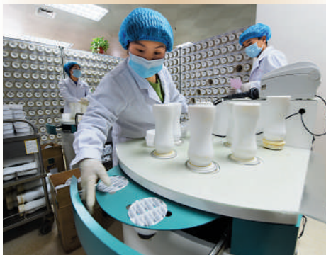
▲▼藥師在配置中藥顆粒。