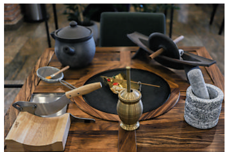
▲「十四五」中醫藥發展規劃提出多項支持行業發展的指標。

再者，在新冠疫情下，愈來愈多人服用中藥治療，培力也有參與其中。早在2020年2月，廣西藥監局通過應急申請程序，批准及授權培力南寧生產清肺排毒湯及康復1號方顆粒，用於治療新冠肺炎患者。有了這次經驗，令市場對培力的生產實力更有信心。