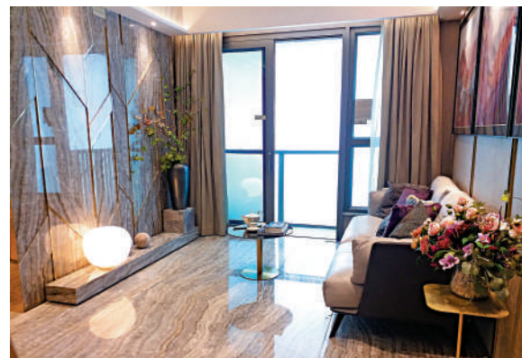
▲SEA TO SKY周五原價重售10伙撻訂貨。圖為示範單位的大廳。

長實地產投資董事郭子威表示，為配合該批單位重售，發展商安排客戶到現樓單位參觀，連日已接待逾100批客戶。他滿有信心表示，海景單位呎價有條件未來升至3萬元水平。