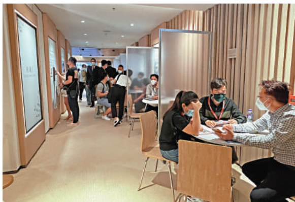
▲柏瓏 I 首輪沽清，次輪明日將悉推327伙。圖為首輪銷售熱鬧情況。

恒地兩盤接連登場，利奧坊，壹隅5月1日率先上陣，即日沽出55伙，帶動過去3日假期新盤錄近80宗成交。項目昨上載全新銷售安排，推出18伙將於5月5日（周四）發售。同系THE HENLEY II今日接棒上陣，首度推出98伙，其中92伙以價單形式發售，發展商公布載收440票，超額3.7倍，另外6伙今日招標。