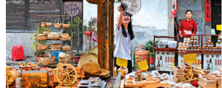
▲潮州市龍湖古寨一商戶擺放的潮汕竹編花籃吸引遊客。

其中，潮州打出傳統文化牌，促進跨境電子商務與潮州文化藝術有機融合，打造獨有的潮州特色「國潮精品」智造品牌聚集地。記者了解到，潮州將推動「楓溪陶瓷」「潮繡晚禮」「鳳凰