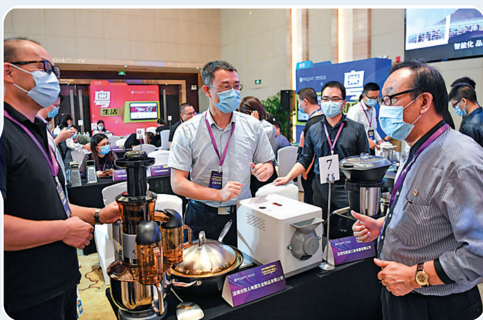
▲廣東5日發布8個跨境電商綜合試區實施方案，推動試區城市外貿發展。圖為第128屆網上廣交會線下活動上，企業代表和採購代表洽談。資料圖片