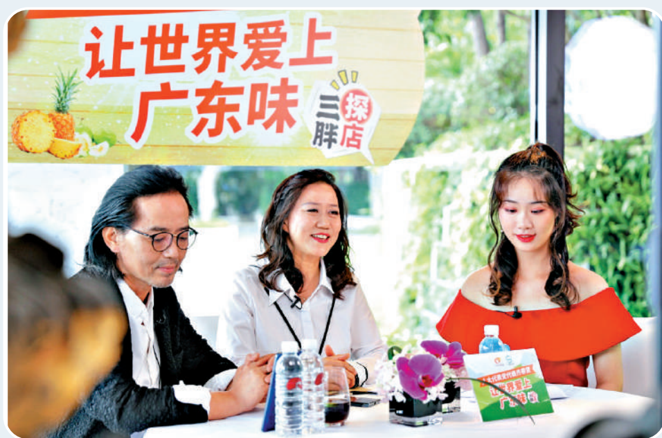
▲廣東8個新增跨境電商綜合試區中，有7個將農產品跨境貿易寫入實施方案，助力廣東農產品走向世界。圖為「讓世界愛上廣東味」直播帶貨活動。資料圖片