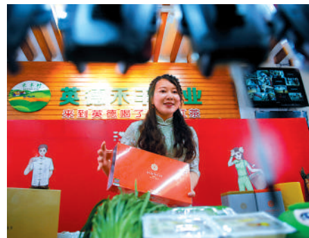
▲女主播在廣東英德電商產業園內通過手機直播推銷當地特產。