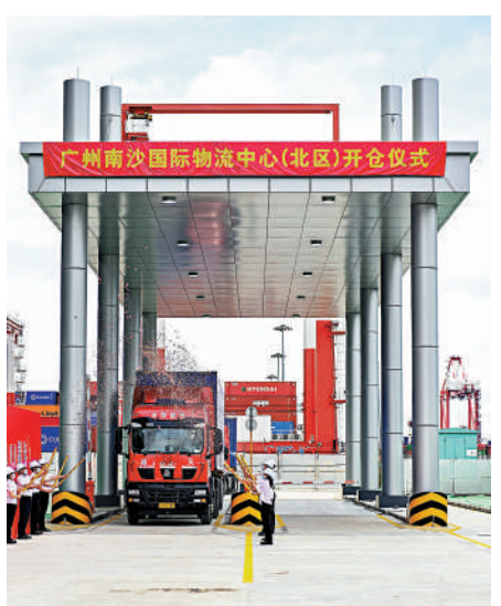
▲去年6月，廣州南沙國際物流中心（北區）開倉試投產，為跨境電商提供海鐵聯運物流等服務。

此外，記者還梳理發現，8個跨境電商綜合試區中，有7個將農產品跨境貿易寫入了實施方案，助力廣東農產品走向世界。以韶關市為例，當地有34家企業（基地）成功入選粵港澳大灣區「菜籃子」生產基地名單。「菜籃子」產品韶關配送中心自去年5月首次發車以來，農產品已實現本土報關、本地查驗、本地封車，出口至東盟泰國、馬來西亞等國家。