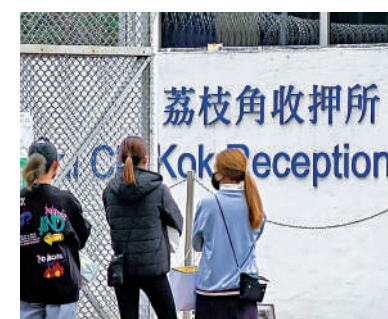
▲懲教署所有親友及公事探訪安排於下周一（9日）起恢復正常。