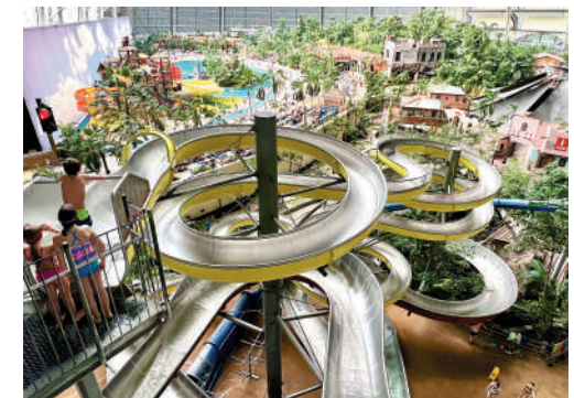
▲帳篷裏的水上遊樂場。