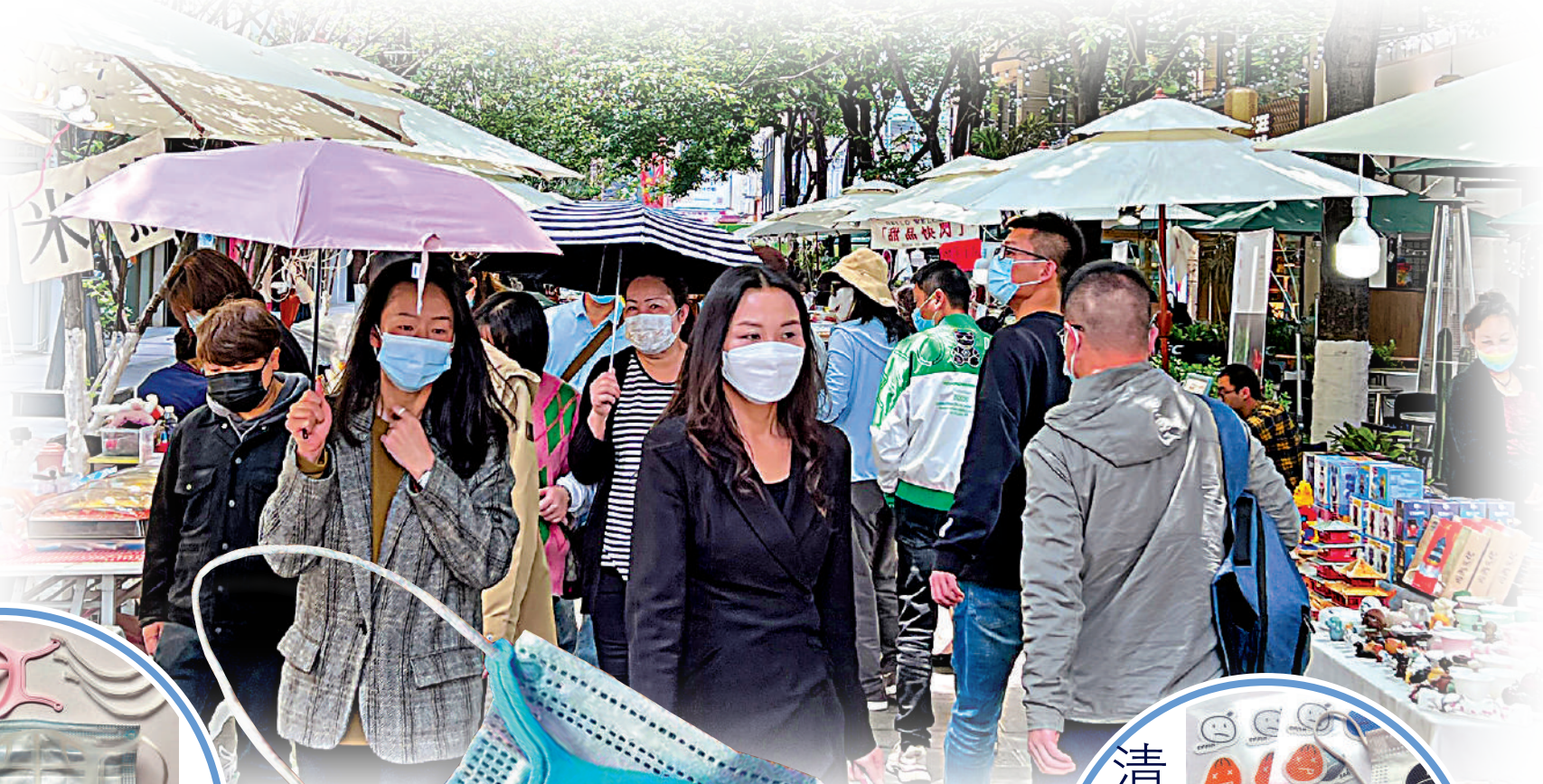
◀由於天氣炎熱，使用口罩防悶「神器」可以讓市民感覺到更加舒適。圖為市民逛集市。