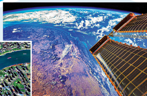
▲◀◻上圖：從太空俯瞰地球的視角照片；左圖：衛星拍攝上海陸家嘴的相片；下圖：宇航員祝福冬奧的合影。

近期，由國家航天局新聞宣傳中心和「我們的太空」創新實踐中心聯合舉辦的「中國航天三十年」攝影藝術展，在北京航天城展出。本文為大家分享的是「太空聚焦篇」，讓我們跟隨攝影師的鏡頭，從太空俯瞰大地，領略藍色星球的獨特魅力，欣賞神州的不同樣貌；在太空艙內環視，感受宇航員的幸福、歡樂，共賞美麗太空。