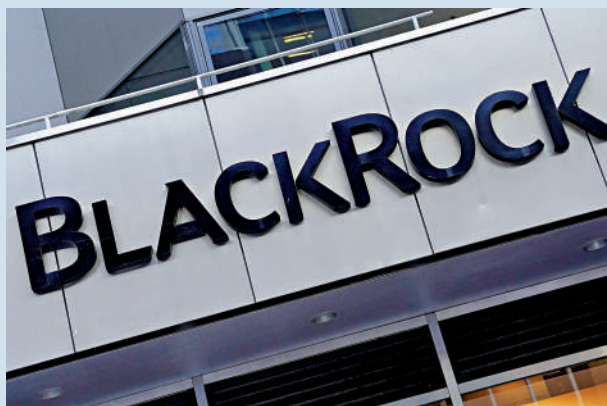
貝萊德基金是首家參與QDLP試點的外商獨資公募基金管理公司。

連平強調，當前上海疫情已得到一定控制，全國其他地區也均採取「盡早發現、盡早管控」的措施，內地疫情整體已處於可控範圍，加之政治局會議釋放的多重積極信號，作為經濟晴雨表的資本市場有望率先回暖。