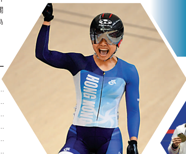
▲香港單車名將李慧詩。