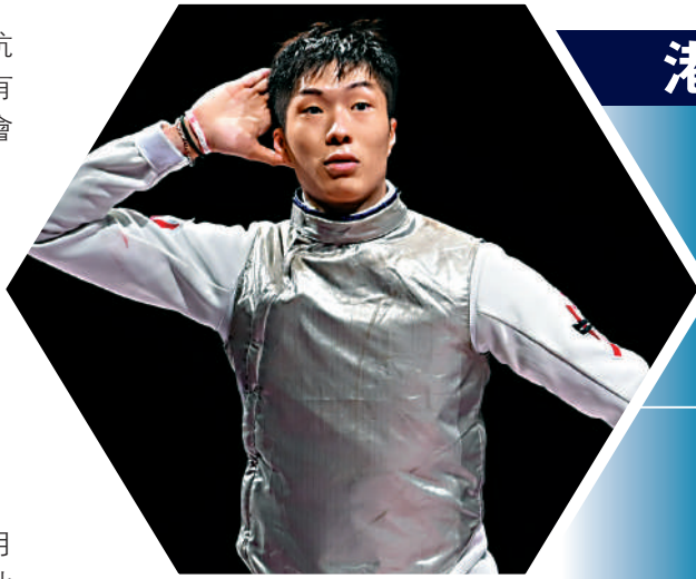
▲東京奧運金牌得主、香港劍擊名將張家朗。