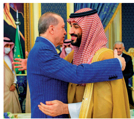
▲埃爾多安（左）4月28日到訪沙特吉達，在會議前擁抱沙特王儲薩勒曼。

【大公報訊】據路透社報導：土耳其總統埃爾多安4月28日抵達沙特阿拉伯海濱城市吉達訪問，並與沙特領導人國王薩勒曼和王儲穆罕默德舉行會晤。這是埃爾多安5年來首次訪問沙特，也是卡舒吉案以來第一次到訪當地。根據沙特官方通訊社發出的照片，埃爾多安與穆罕默德見面時微笑擁抱。埃爾多安表示，此次出訪將為兩國關係打開新篇章。