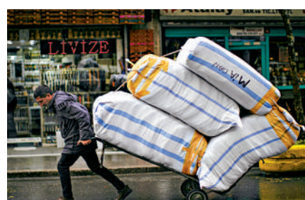
▲土耳其國力難以承載埃爾多安的「泛突厥主義」夢想。

治戰略重點推行。2010年，突厥語國家合作委員會在伊斯坦布爾正式成立，土庫曼斯坦和烏茲別克斯坦因種種原因沒有參加。2010年，時任土耳其總統居爾梅出「一族六國」的口號後，擴員問題被提上議程。2018年匈牙利獲得觀察員國地位，2019年烏茲別克斯坦加入。2020年8月，烏克蘭