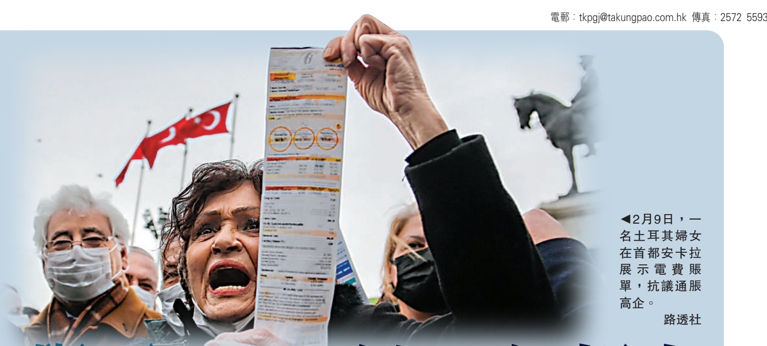
◀2月9日，一名土耳其婦女在首都安卡拉展示電費賬單，抗議通脹高企。