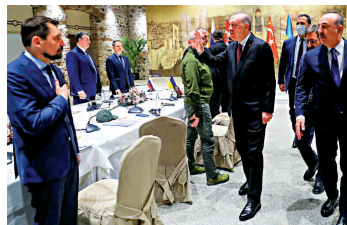
▲3月29日伊斯坦布爾舉行俄烏會談期間，埃爾多安（右二）迎接兩國代表團。