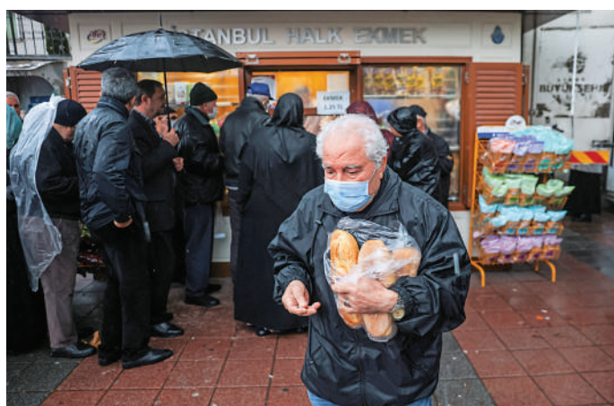
▲物價持續高漲使土耳其民眾排隊搶購物資。

分析認為，土耳其近來積極參與國際事務，與國內形勢不無關係。目前土耳其民眾對物價飛漲的不滿情緒十分強烈，嚴重影響到埃爾多安政府的執政穩定。埃爾多安在此時積極參與地區事務，開展軍事行動，試圖轉移公眾對其困境的注意力、緩解國內內政壓力。