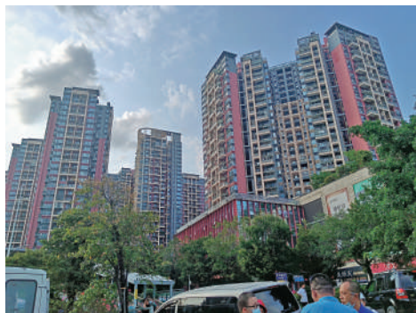
▲信義嘉御山鄰近地鐵坂田北站，升值潛力大。

馮金稱，除了贈送面積多，信義嘉御山社區健康服務中心的建築面積達400平米，居住小區級文化室建築面積