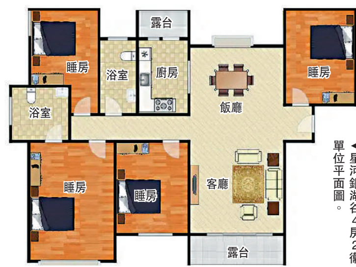
星河銀湖谷4房2衛單位平面圖。