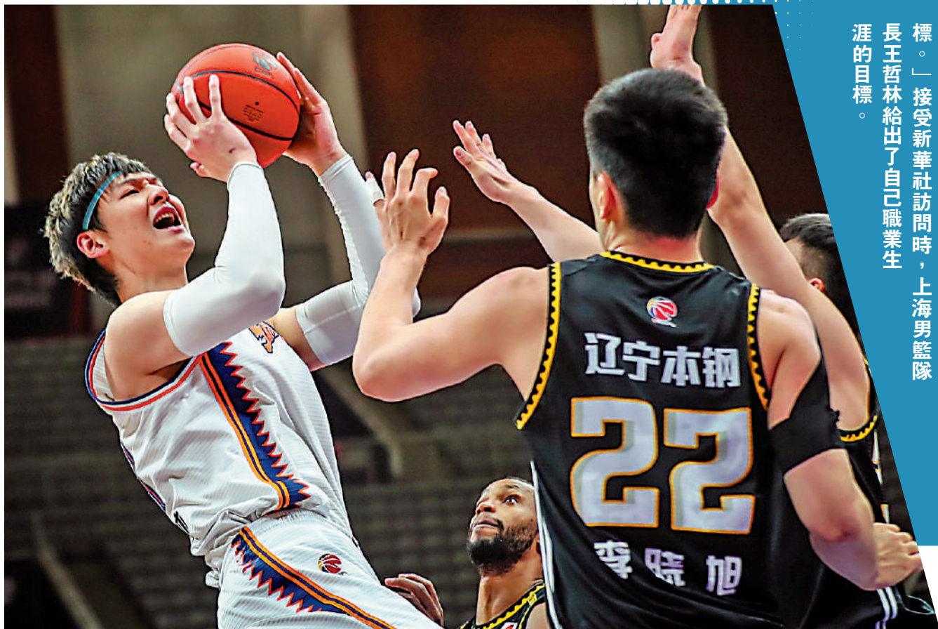
▶王哲林去年中加盟上海男籃。資料圖片