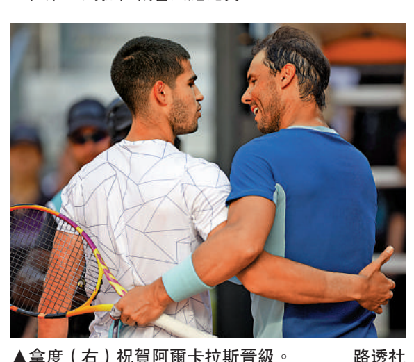
▶拿度(右)祝賀阿爾卡拉斯晉級。

祖高域本輪面對靴卡斯，以6:3、6:4輕鬆取勝。比賽伊始，祖高域便破掉對手首個發球局，一路領先拿下第一盤。次盤，祖高域在第5局破發，並在第10局抓住機會終結比賽。