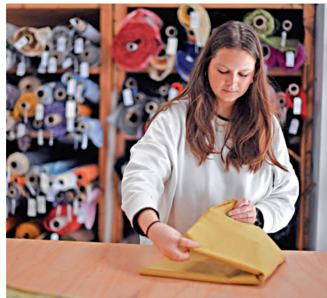
◀NFT與服裝產業結合，對服裝設計師有兩大利好因素。