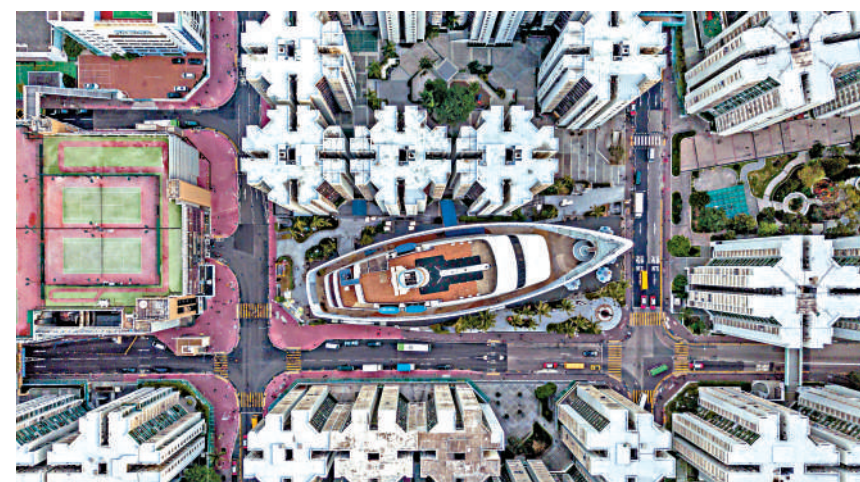
◀疫情緩和及社交距離措施放寬，購買力逐漸釋放，市場筭盤買少見少。

有一點要留意，雖然按揭預批結果已大致上確定批出貸款，但當中由於未正式進入律師樓跟進階段，若最終物業出現預批時未發現的業權問題，仍需待業權清晰或銀行接納解決方案，方可獲銀行正式發放貸款額完成交易，但這僅屬個別情況。