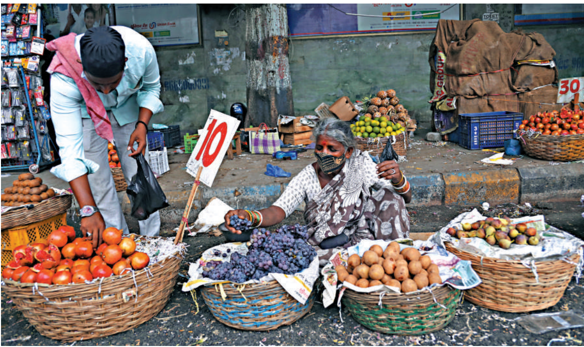
▶印度經貿復甦已基本步入正軌，但消費的修復偏弱。

印度被視為目前最具發展潛力的新興經濟體之一，也是印太地緣政治圈的焦點。儘管印度經濟在疫情期間經歷了短期衰退，生產和投資大幅萎縮，出口產能也受到重創，但經過一年修復期後，經貿開始走向復甦，2021年國內生產總值（GDP）創下8.9%的高增長水平。眼下印度經貿復甦也面臨通脹上升、匯率波動加劇，以及美元流動性收緊等不利因素，復甦可能仍有一些障礙。