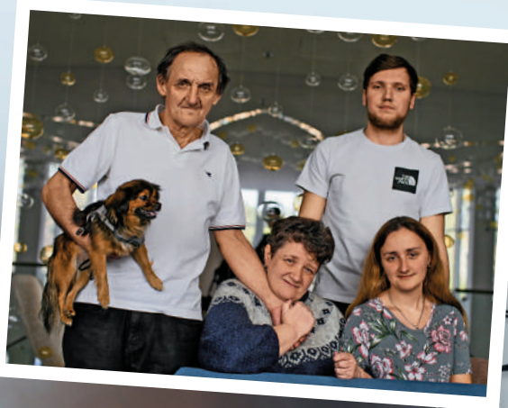
▶ 從亞速鋼鐵廠撤出的烏克蘭家庭4日拍攝合照。美聯社