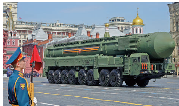
◀「亞爾斯」導彈7日亮相莫斯科紅場。

空中飛行編隊則由世界上最大的運輸直升機米-26領航，一架伊爾-80空中戰略指揮機由兩架米格-29戰機伴飛。圖-95MS戰略轟炸機、圖-160戰略轟炸機、伊爾-78空中加油機、蘇-35戰鬥機、米格-31戰鬥機、圖-22M3遠程轟炸機以及第五代戰鬥機蘇-57也在7日的綵排中亮相。