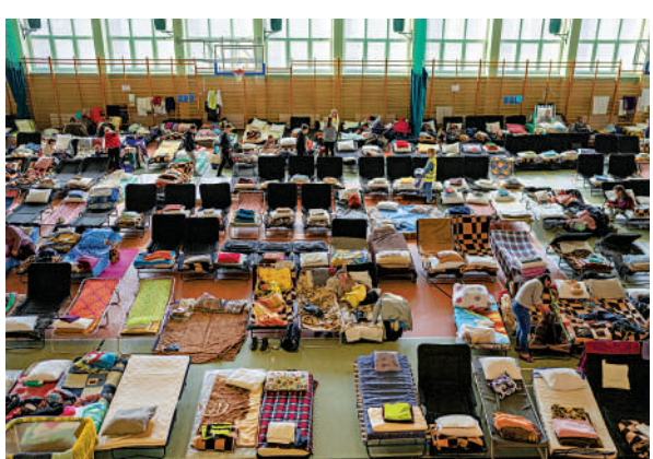
許多歐洲國家的難民中心人滿為患。

【大公報訊】綜合《衛報》、BBC、路透社報導：俄烏戰爭爆發後，已有約500萬名烏克蘭難民逃往別國，造成「二戰以來歐洲最大的難民危機」。英國此前提出所謂的「烏克蘭之家」計劃，有意願的英國民眾可申請收容陌生烏克蘭難民。近日該計劃被爆有重大安全疑慮，讓這些流離失所的烏克蘭女性成為不法分子的「獵物」。