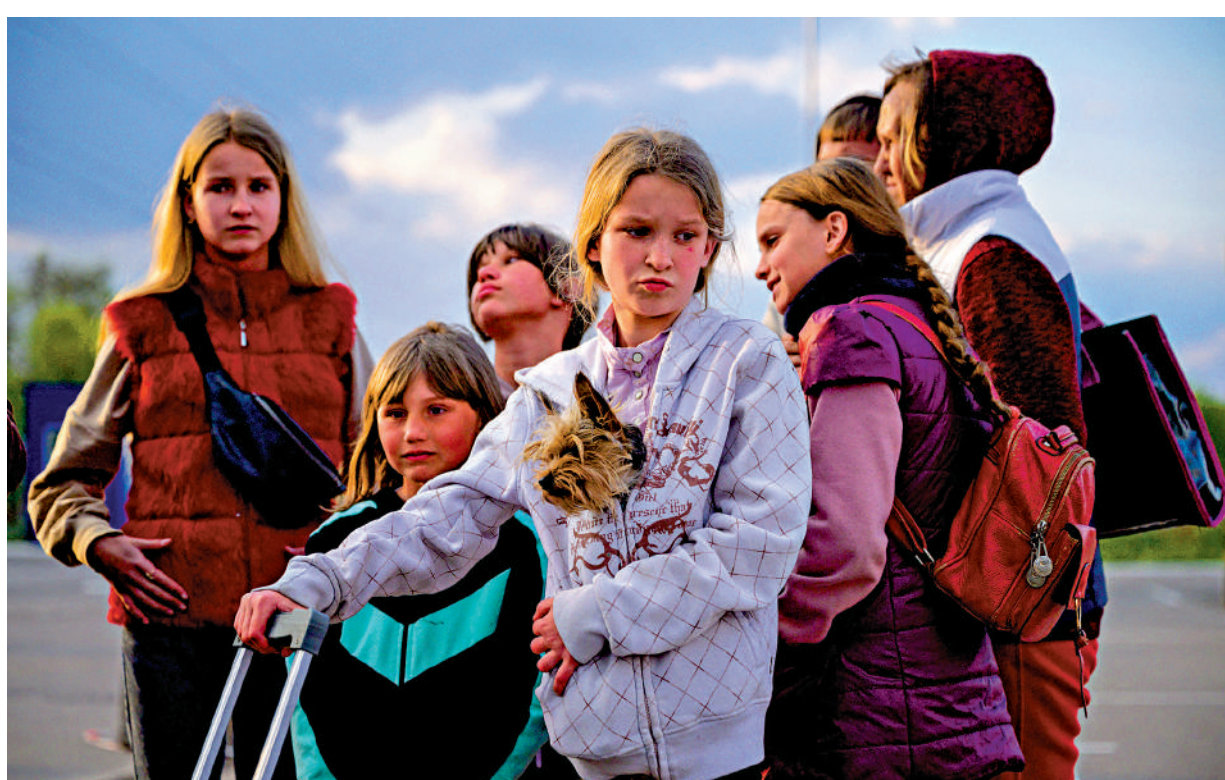
從烏克蘭逃出的難民多數為婦女及兒童，有不法分子趁虛而入。

另一名來自曼徹斯特的男子，則是在多個FB群組中，發布向多位烏克蘭單身女性提供住宿的信息。該男子據悉也是「單身烏克蘭女性」交友網站的成員，過去曾在