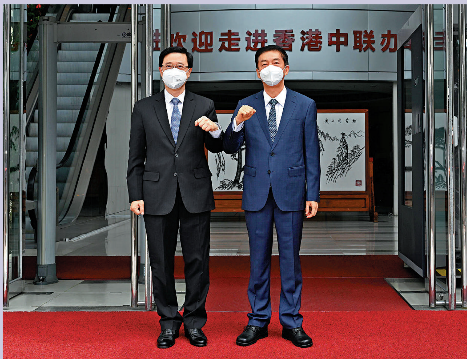
▲中聯辦主任駱惠寧（右）迎接到訪的第六任行政長官人選李家超，表示中聯辦將一如既往，全力支持行政長官和特區政府依法施政，堅決保持香港長期繁榮穩定。

香港中聯辦副主任陳冬、盧新寧、譚鐵牛、羅永綱、何靖、尹宗華和秘書長王松苗參加會見。