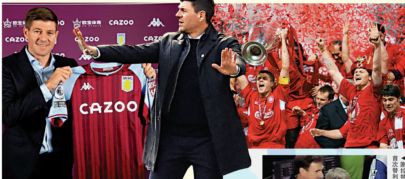
謝拉特於去年11月獲維拉從蘇