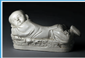
▲故宮珍藏陶瓷「孩形枕」 ▲乾隆帝歲朝行樂圖