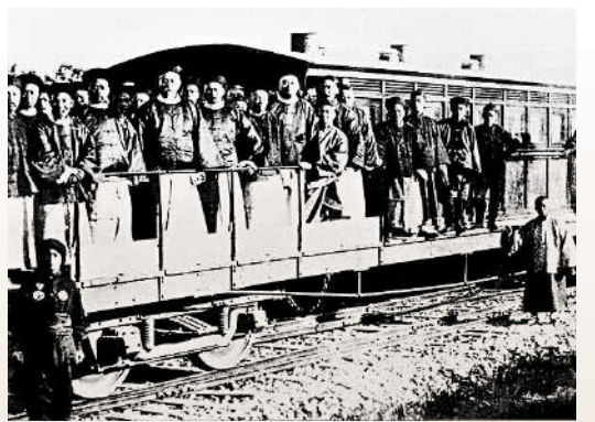
▲中史科卷一有涉及洋務運動的試題。 ▲中史科卷二題目考五四新文化運動、北魏均田制、道教起源等內容。有考生表示今年試題難度與題型都與往年相若。

中史科考試設兩卷，今年卷一繼續取消必答題，改為第一部分的甲部及乙部各設1題，考生須選答1題。甲部試題涉及秦始皇、漢武帝面對的管治問題、如何加強中央集權等。而乙部則問及八國聯軍之役使清朝成為了「崩裂了的中國巨人」，要求考生引用史實印證觀點。