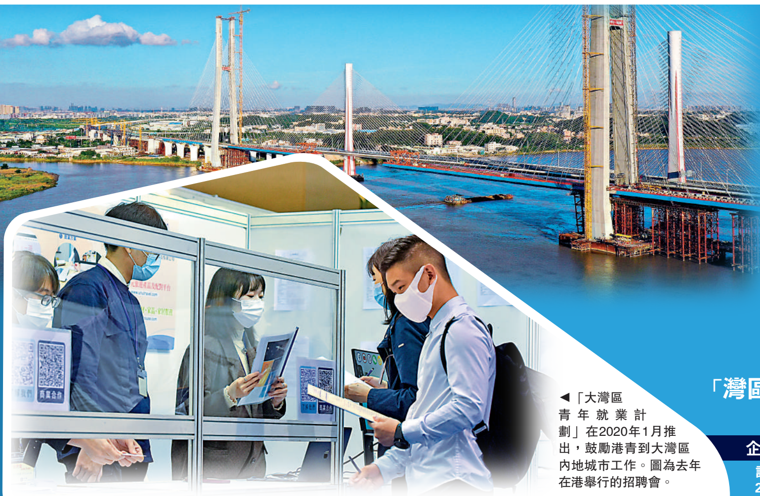
◀「大灣區青年就業計劃」在2020年1月推出，鼓勵港青到大灣區內地城市工作。圖為去年在港舉行的招聘會。