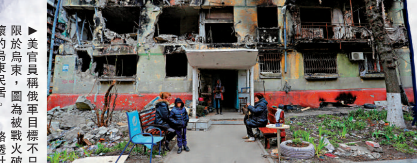
▲美官員稱俄軍目標不局限於烏東，圖為被戰火破壞的烏東民居。