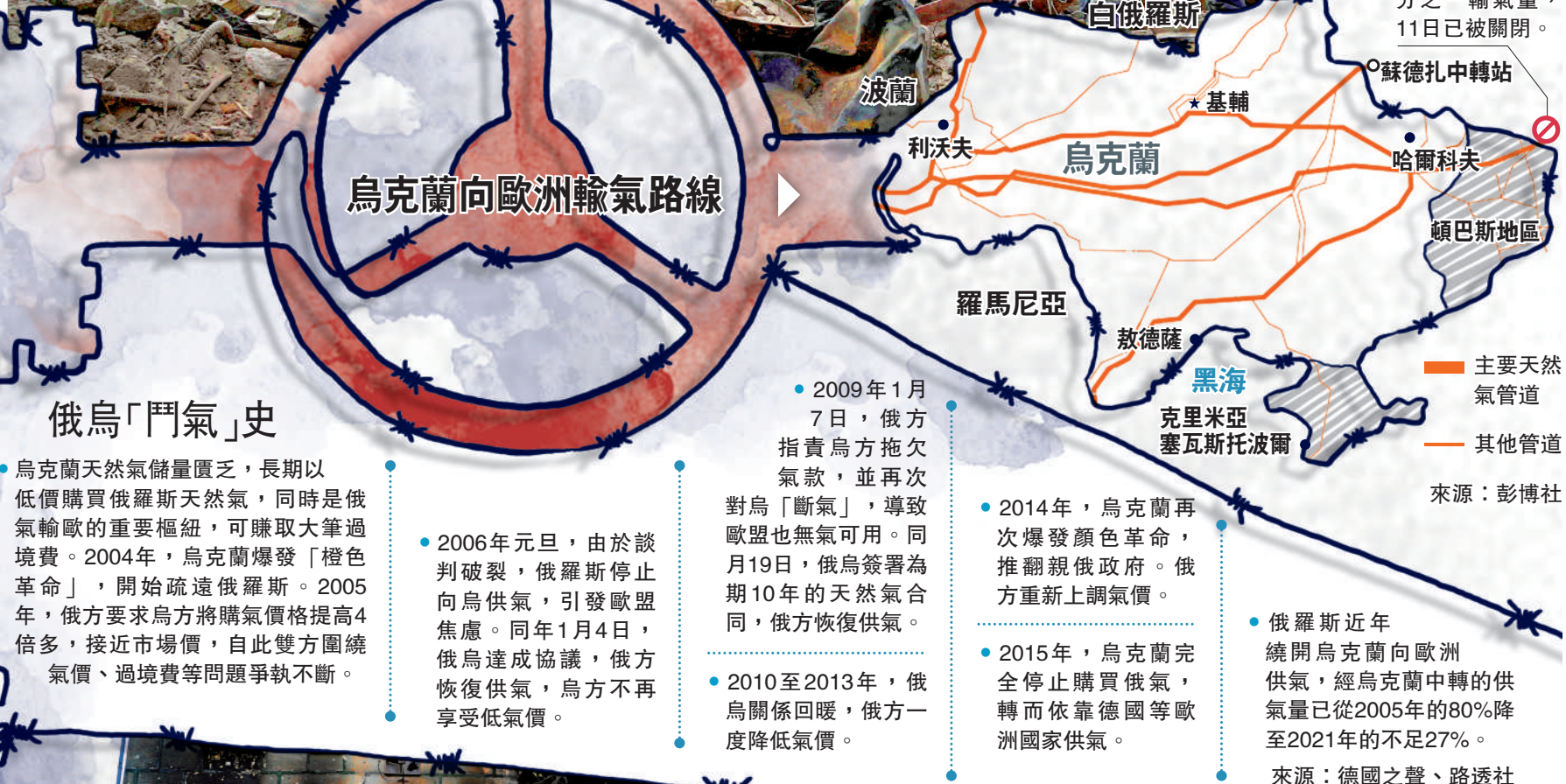
● 2009年1月7日，俄方指責烏方拖欠氣款，並再次對烏「斷氣」，導致歐盟也無氣可用。同月19日，俄烏簽署為期10年的天然氣合同，俄方恢復供氣。 ● 2010至2013年，俄烏關係回暖，俄方一度降低氣價。 ● 2014年，烏克蘭再次爆發顏色革命，推翻親俄政府。俄方重新上調氣價。 ● 2015年，烏克蘭完全停止購買俄氣，轉而依靠德國等歐洲國家供氣。 ● 俄羅斯近年繞開烏克蘭向歐洲供氣，經烏克蘭中轉的供氣量已從2005年的80%降至2021年的不足27%。

美國副總統哈里斯10日在華府接待來訪的保加利亞總理佩特科夫，並將美國液化天然氣賣給保加利亞。據報導，美國將從6月開始向保加利亞供氣。