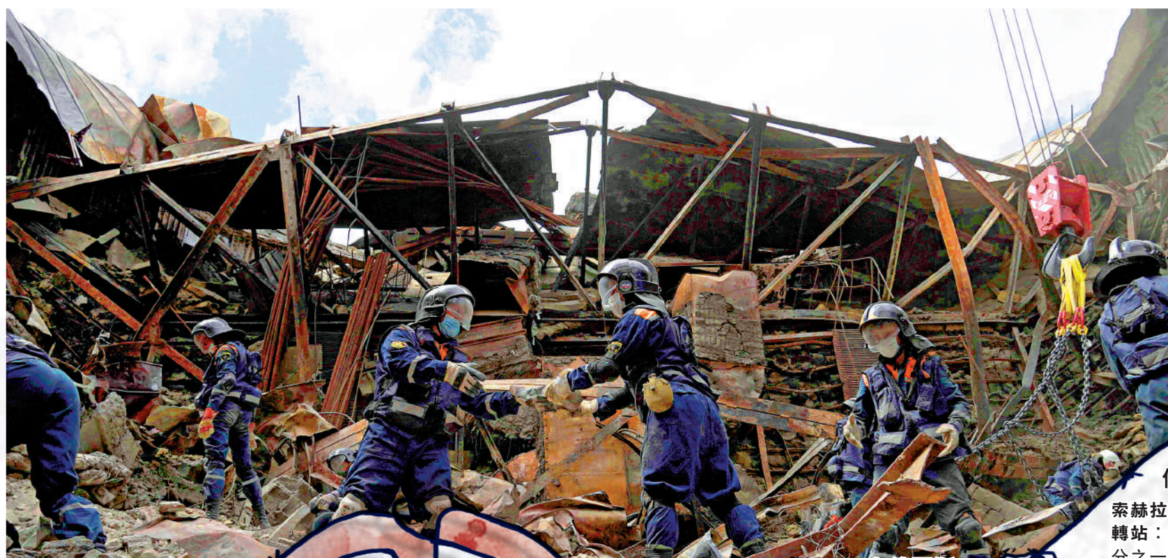
▲烏克蘭聲稱無法運營俄軍控制地區的天然氣設施，圖為俄方控制的烏東馬里烏波爾地區。法新社

【大公報訊】綜合路透社、法新社、德國之聲報導：烏克蘭10日突然宣布，由於俄軍「干預天然氣運輸」，烏方決定於11日起中斷烏東一處主要天然氣中轉站向歐洲輸氣量驟減四分之一。 這是俄烏衝突爆發以來，經過烏克蘭的天然氣輸送服務首次被擾亂。俄方否認認烏方指控，並強調已按照合同向烏方支付天然氣過境費用。有評論指，烏方收費後卻毀約，連累依賴俄氣的歐洲盟友須尋找其他「氣源」。