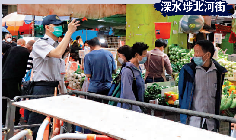
▲食環署人員到場拍照但離去之後，店舖又將物品擺出行人路。