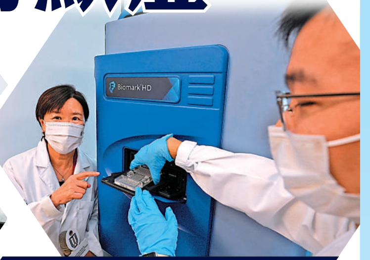
研究團隊研發出簡單血液測試方法，利用圖中的儀器可驗出血液樣本是否含有與阿爾茲海默症相關的蛋白。

阿爾茲海默症（簡稱AD）是最常見的認知障礙症，但一直沒有有效治療方法。香港科技大學（科大）於2020年成立香港神經退行性疾病中心（HKEND），研究團隊於AD的早期診斷和治療方面取得突破。團隊成功於千多種蛋白中，分辨出與AD病症相關的19種蛋白，只需一滴血即可篩查出AD患者，準確度高達96%。