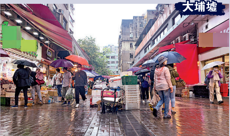
▲有商販直接將貨物放在行人路中間販賣。