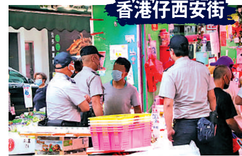
▲食環署人員勸喻店舖將貨物搬回店內。

因法例存在灰色地帶，部門執法先是口頭勸喻，或發通告移走佔道物資，「即使發出告票也只是罰款1500元，仲平過交租。」