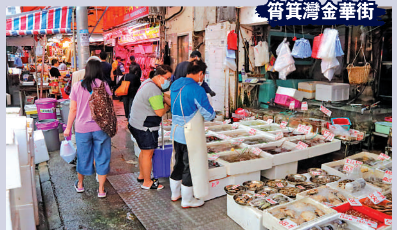
▲海鮮店霸佔行人路經營。