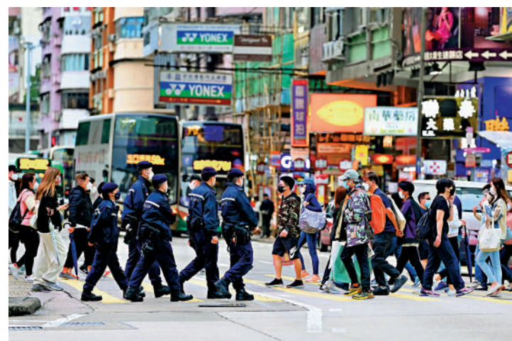
警方表示，今年首季香港的治安相對穩定，整體罪案下跌。

警方總結，今年首季香港的整體治安情況穩定，並指出在與市民同心抗疫之餘，會繼續投入大量資源於宣傳教育，並透過多機構協作、加強採取以情報為主導的執法行動等遏止各種罪案，尤其是網上騙案及青少年干犯刑事罪行。