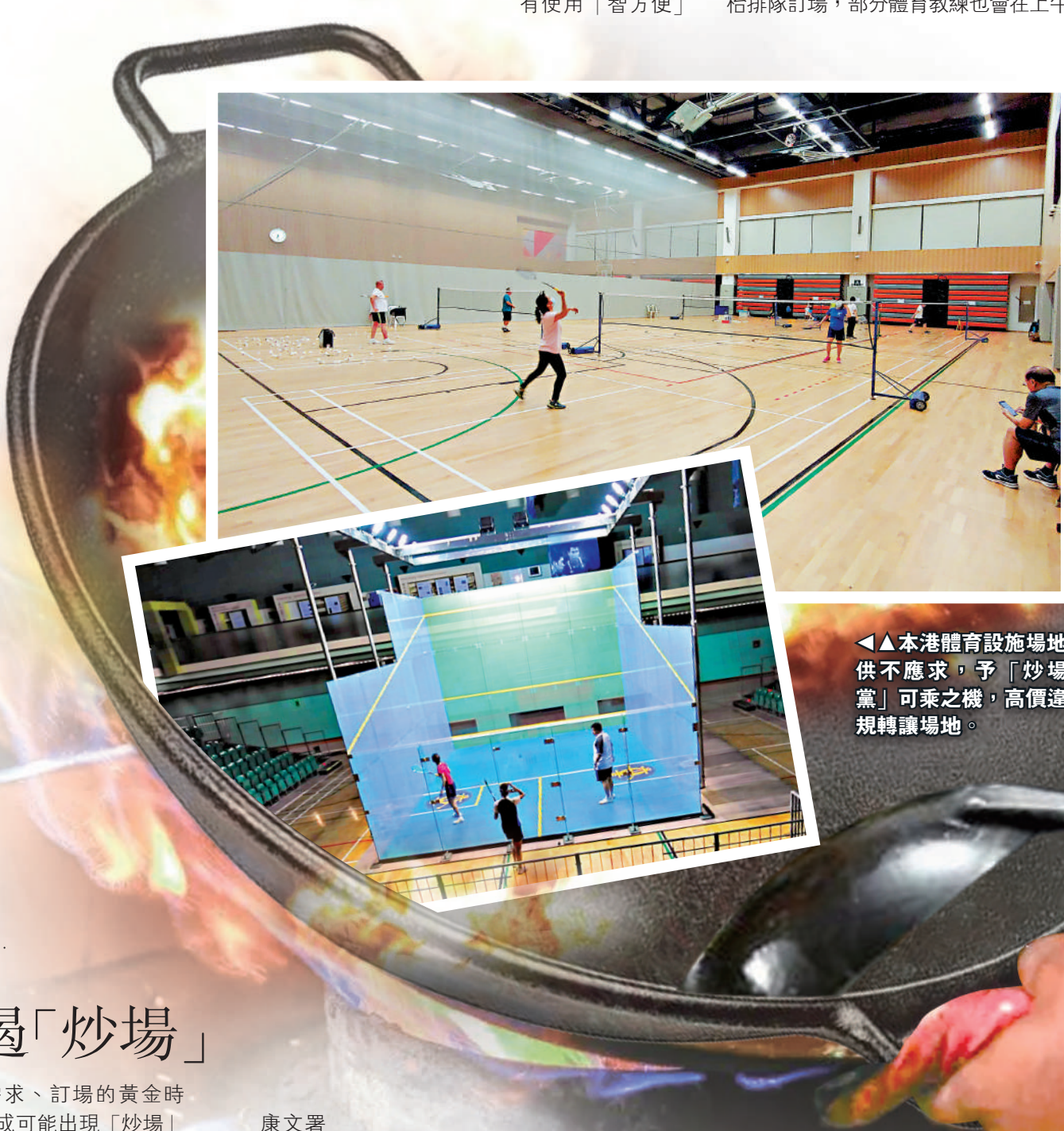
本港體育設施場地供不應求，予「炒場黨」可乘之機，高價違規轉讓場地。