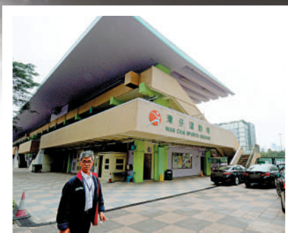
康文署在本月接連推出多項措施，打擊猖獗的「炒場黨」。

長遠而言，杜絕「炒場」必須增加康體場地，避免僧多粥少情況。其次，每隔一段時間檢討場地使用需求，適時調整及變更康體設施，才是治本。