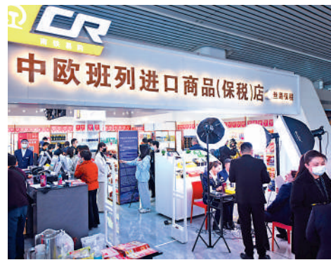
▲中國簽署的自貿協定數量十年增長了近一倍。圖為福州民眾在中歐班列進口商品（保稅）店購物。