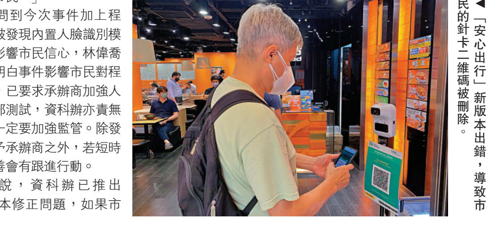
▲「安心出行」新版本出錯，導致市民的針卡二維碼被刪除。

民由舊版本直接更新至最新版本，將不受影響。他說，除了憑紙本針卡再掃描二維碼外，亦可以到疫苗接種網站輸入身份證號碼、簽發日期及最後接種疫苗日期等資料，可取回電子針卡二維碼。