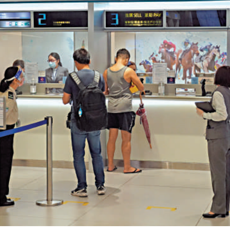
▲賽馬會場外投注站恢復現金受注。

香港賽馬會場外投注站昨起恢復現金受注，不少市民對於能夠再用現金投注表示興奮，有人更表示會多買幾張六合彩電腦票，追回之前「無得買」的損失。 大公報記者昨分別到西環及香港仔的投注站觀察，黃雨都無礙市民親自到投注站落注。市民李先生表示，由於本身沒有網上和電話戶口，已經近一年無投注，故特意多買幾張六合彩電腦票。