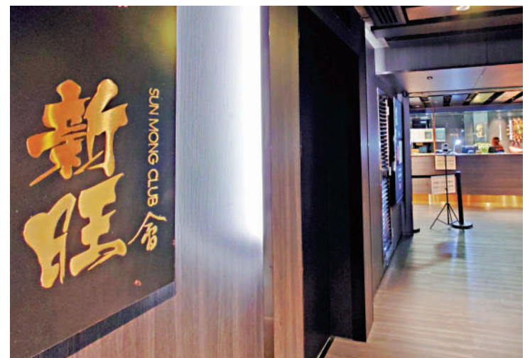
▲紅磡一間桌球會疑出現傳播，至今錄4人染疫，同場約150人需強檢。