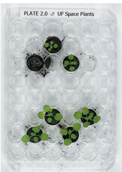
▲科學家在2021年首次使用月球土壤來栽種植物。

據報道，該次實驗使用總共12克月壤，來自美國太空總署（NASA）在1960至1970年代的阿波羅11號、12號和17號三次登月任務。在小頂針大小的盆子裏，研究人員放入約1克月壤，加水，然後放入種子。他們還每天給這些植物營養液。