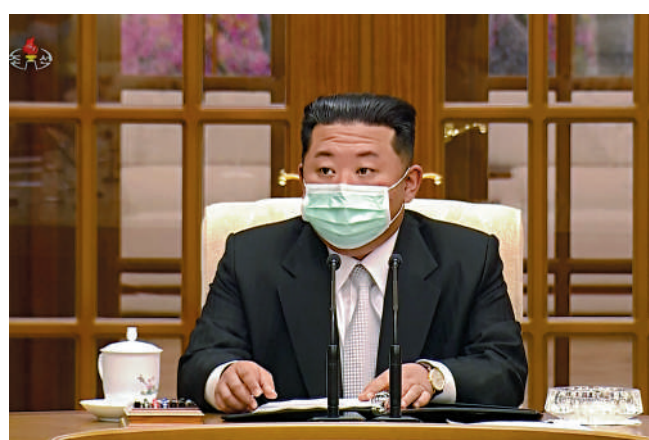
▲朝鮮領導人金正恩12日戴着口罩主持會議。

朝鮮勞動黨總書記、朝鮮國務委員會長金正恩12日視察了朝鮮國家緊急防疫司令部。金正恩稱，當務之急是主動封閉發熱地區、嚴格處理發熱患者隔離就醫、全力救治患者、切斷傳