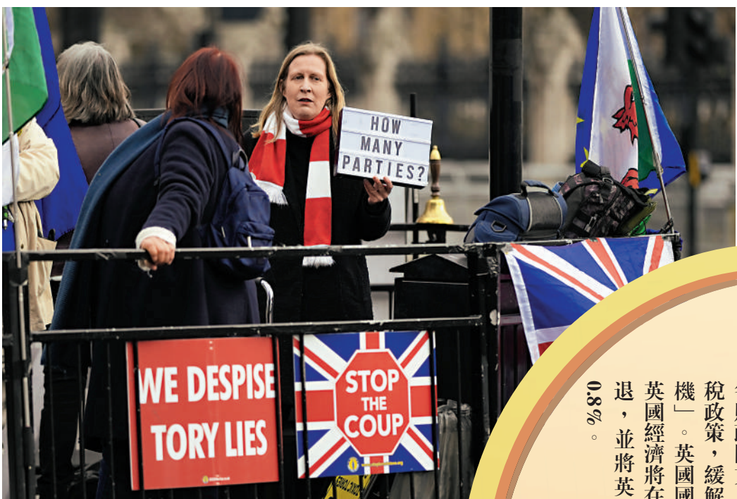
▲一名示威者抗議約翰遜在疫期間違規舉行派對。