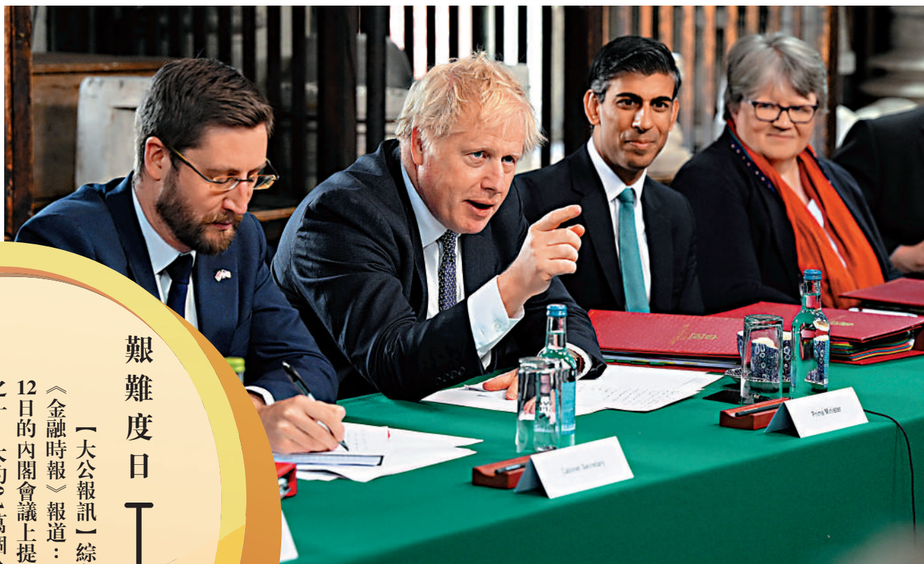
▲英國首相約翰遜在12日的內閣會議上提出削減公務員人數。