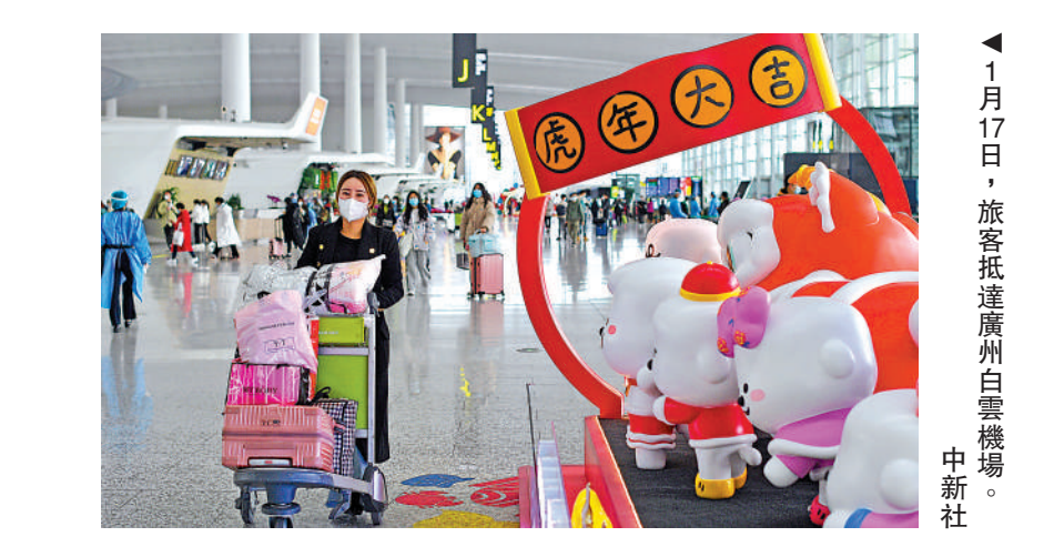
1月17日，旅客抵達廣州白雲機場。

股權融合 優勢互補 「穗港深機場目前都在擴建新跑道，這三大機場均作為灣區的核心機場，通過『你追我趕』的良好競爭，也有利於促進灣區建設世界級機場群。」中山大學港澳珠三角研究中心教授鄭天祥表示，在粵港澳大灣區作為國家戰略推進過程中，灣區機場群「互補」協同合作發展的步伐會加快。據了解，大珠三角五大機場主席會議自2009年舉辦至今已十多屆，到2019年2月國家出台《粵港澳大灣區發展規劃綱要》後，更名為「粵港澳大灣區五大機場高層聯席會議」（下稱「A5會議」）。其間各方在地面交 通、空域資源、航線網絡、技術創新、產業培育等方面深化協商合作，而去年會議以「後疫情時代，新的機場管理模式」為主題，深入探討「機場在旅客服務方面的轉型和升級」。 「在粵港澳大灣區作為國家戰略推進過程中，灣區機場群也要進一步優化合作機制，拓展合作規模，譬如完善『5A會議』合作機制，加快建立大灣區機場協同發展機制。」鄭天祥建議，在符合國家民航相關規定下，可推進粵港澳機場之間開展股權合作，通過股權融合共同推動形成機場群優勢互補、緊密協作、聯動發展的良好格局。 大公報記者 方俊明