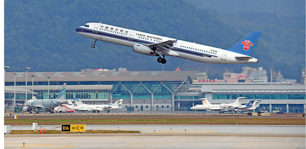
1月6日，一架飛機從深圳寶安國際機場起飛。

港可發展高增值貨運 廣東省發改委有關負責人稱：「為促進灣區機場群實現差異化協同發展，廣東省發改委還將攜手民航中南地區管理部門、廣東省國資委、省機場集團以及有關地市政府，積極與港澳合作對接，加強機場功能和航線網絡分工協調。」廣東省社科院專家表示：「相比廣州機場重點打造具有全球影響力的飛機維修與製造、公務機通用航空、航空貨運物流及服務貿易產業集群，香港可依托香港國際航空樞紐和物流供應鏈優勢，利用自由貿易島政策，大力發展高增值空港經濟，重點打造國際航空學院，發展高增值貨運、飛機租賃和航空融資業務等。」深圳機場可促進深圳空港經濟