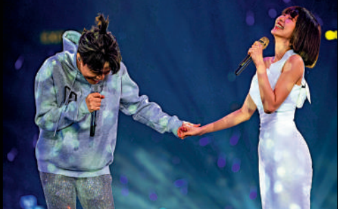
▲張敬軒（左）讚林明禎漂亮。