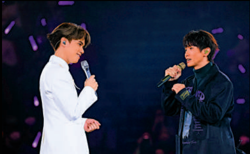
▲張敬軒（左）邀請陳柏宇擔任演唱會嘉賓。