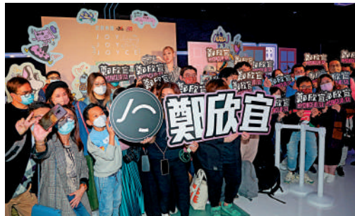
▲鄭欣宜（後）近年歌壇成績不俗，圖為今年年初她舉行新碟欣賞會時與樂迷合影。