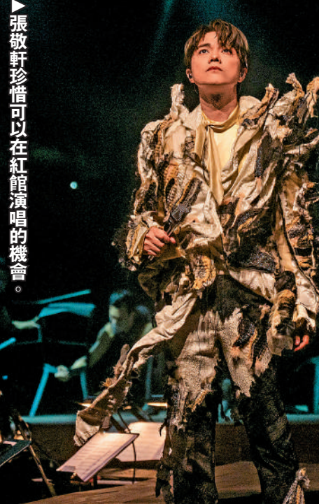
▲張敬軒珍惜可以在紅館演唱的機會。