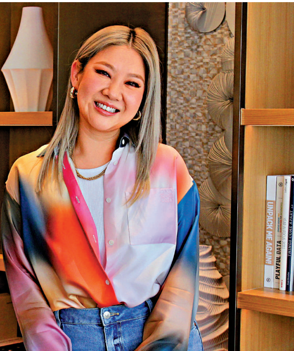
▲鄭欣宜會否性感上陣，暫時不作透露。