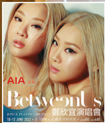
▲鄭欣宜演唱會海報。