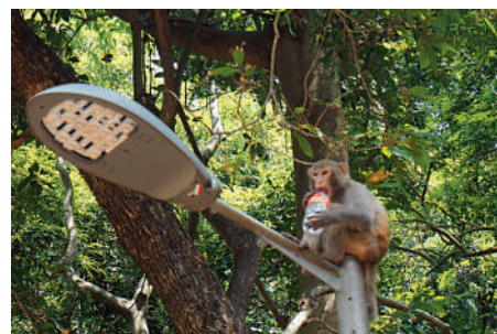
▲路上不時有獼猴出沒。

時，白千層倒影處處，會出現期間限定的「水浸白千層」，吸引許多人前來遊覽，拍攝「天空之鏡」。由於白千層能抵受乾旱及潮濕的環境，又具防火功效，故水塘畔廣植白千層。樹如其名，白千層的樹皮呈海綿狀，薄如紙，生長時新的樹皮將舊的往外推，形成層層疊疊的狀態。葉片帶有清新藥油氣味。行山人士多在這裏歇腳賞美景，或傾聽鳥鳴和流水聲，享受片刻的閒情逸趣。