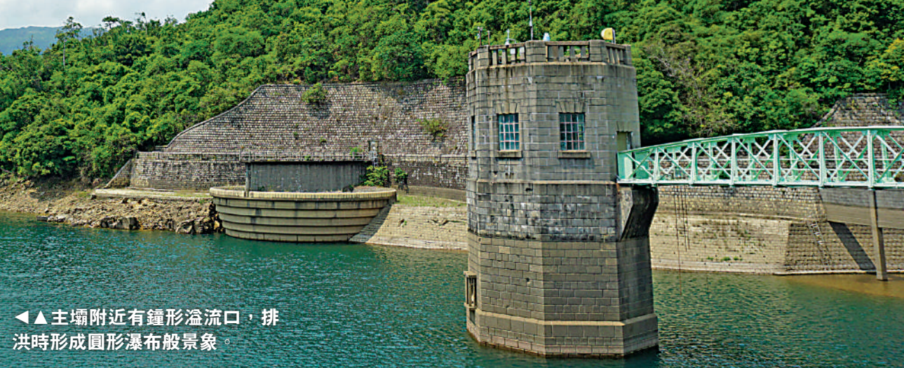
▲主壩附近有鐘形溢流口，排洪時形成圓形瀑布般景象。