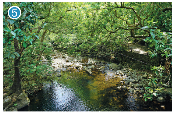
▲途中經過溪澗，潺潺流水。