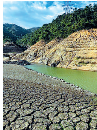
▲下城門水塘龜裂情況屬正常。

現象指，城門水塘的水系分成上、下城門水塘兩部分。上城門水塘主要作儲水功能；下城門水塘作調節、防洪及鞏固堤壩功能為主，所以水塘超過七成水量都儲藏在上城門水塘，下城門水塘在乾旱季節有龜裂情況實屬正常。