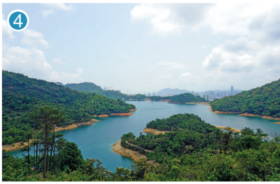
▲享逸台景觀開揚，可遠眺葵涌區的城市天際線。