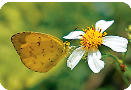
寬邊黃粉蝶 ( Eurema hecabe )

體型中等，常見、全年出現。展翅四至五厘米，翅面黑色，有白斑。翅底黑色，前翅有清晰的翅脈和白斑，後翅有鮮艷的黃斑和位於基部的紅斑。喜歡低飛，不難接近。