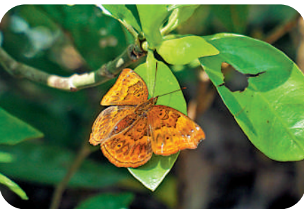
羅蛺蝶 ( Rohana parisatis )

體型小，常見、全年出現。展翅四至五厘米，翅膀鮮黃色，翅面邊緣有黑色寬帶。翅底有數量不等的紅褐色斑點。牠們是本地最常見的蝴蝶之一，飛行緩慢，很少停留，警覺性極高。