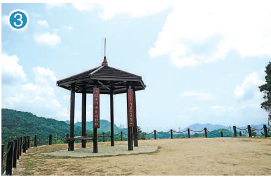
▲六角形涼亭享逸台是去年新設的景點。

此程最後一個打卡點是主壩，附近有鐘形溢流口，當水塘滿載的時候，多餘的儲水就會由這個「大水碗」排到下城門水塘，形成圓形瀑布般景象。不過這是一項水務設施，通往溢流口的小徑是禁止入內。主壩除了是供應淡水的重要設施，更是灌溉水塘兩岸動植物的生命之源。處處見生機，一路上不時有獼猴出沒，牠們三五成群，雖然十分可愛，但切勿餵飼。