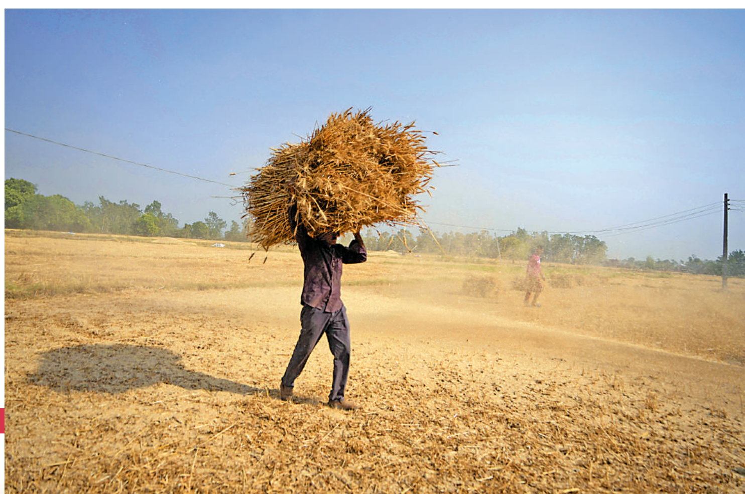
▲4月以來，印度遭遇異常熱浪導致小麥產量下降。