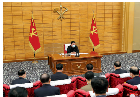
▲朝鮮領導人金正恩14日主持朝鮮勞動黨中央委員會政治局會議，對防疫政策作出指示。

在回覆韓聯社詢問時表示，若「新冠疫苗實施計劃」(COVAX)決定向朝鮮援助美國輝瑞疫苗，美方將予以支持。發言人表示，美方強烈支持包括疫情防控在內的韓朝合作，相信韓朝合作能為在朝鮮半島營造更穩定的環境做出重要貢獻。