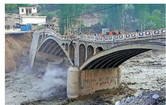
▲在巴基斯坦北部罕薩區，一座橋樑因冰川湖潰堤後引發的洪水而倒塌。

除南極和北極外，巴基斯坦是世界上冰川面積最大的國家，約為13,680平方公里，佔上印度河盆地山地面積的13%。冰川湖暴增現象不止出現在巴基斯坦，根據美國太空總署(NASA)的研究，過去30年，全球冰川湖增加了48%。