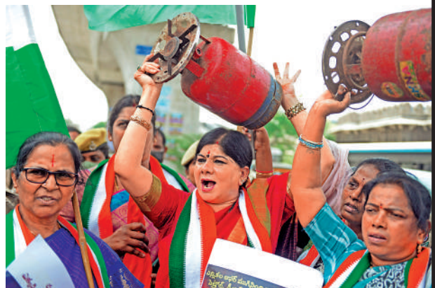
▲印度國會議員6日在海得拉巴抗議能源價格上漲。

【大公報訊】綜合《印度時報》、路透社、彭博社報道：印度政府13日晚簽發命令，宣布立即禁止所有小麥出口，理由是其國內糧食安全面臨風險。印度近期遭遇了嚴重熱浪以及國內食品價格急劇上漲等問題，官方希望通過禁止小麥出口來抑制食品漲價。俄烏衝突影響黑海地區糧食出口，加上多國轉向「糧食保護主義」，勢進一步推高通脹和食物價格，加劇糧荒饑荒。