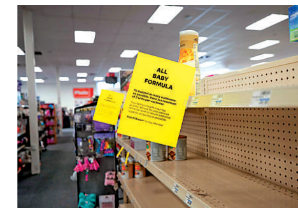
▲美國近日奶粉嚴重缺貨，超市貨架被搶購一空。

商的嬰兒配方奶粉也已全部售罄。CVS健康公司等部分零售商發表聲明，由於供應短缺，已實施嬰兒配方奶粉限購措施。