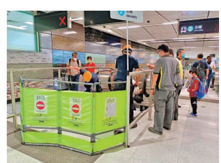
會展站扶手電梯昨一度出現故障。

三站今加派400職員助乘客 東鐵過海段通車後今天迎來首個上班日，將考驗九卡車的運載力。港鐵車務總監李家潤昨日表示，為確保日後運作暢順，通車初期會在會展站、紅磡站及金鐘站加派逾400名職員。通車後繁忙時間將增加至2.7分鐘一班車，有需要時會加派短途「子彈車」，而列車在使用新信號系統後班次更密，九卡車將有更大載容量。 此外，昨日會展站大堂直達底層1號月台扶手電梯突然故障停止運作，金鐘站內亦見到由大堂直達東鐵線月台的扶手電梯暫停運作。李家潤表示，涉事扶手梯因運作不暢順而觸發保護裝置，在工程人員檢查後已復舊，希望公眾明白理解新設備需要時間磨合。 全新的會展站、擴建的紅磡站及「超級轉車站」金鐘站，昨日有近18萬人次出入。