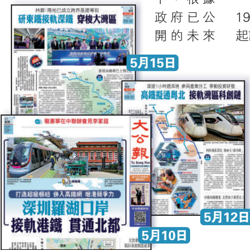
《大公報》連日報道港鐵未來發展會與深圳接軌，穿梭大灣區。

東鐵走過百年路程，經歷過總站搬遷、沿途車站增減、支線停運，甚至行走的路線都因應時代發展而有所改動，印證香港時代變遷。不過，東鐵的發展步伐尚未停下，根據政府已公開的未來 鐵路發展規劃中，至少尚有三個車站待發展，包括已拍板興建、接駁北環綫及東鐵的古洞站，將於2027年竣工；去年施政報告提出，在大學站與大埔墟站之間增設的白石角站，以及計劃在羅湖及上水站之間增設的羅湖南站。 東鐵前身、九廣鐵路在1910年通車，當年由尖沙咀總站起計，在香港境內全綫只有7個車站。配合新界發展，東鐵多年來加入多個新車站，包括1930年啟用的上水站、1956年加設的馬料水站（後易名為大學站）、1978年增設的馬場站、1982年增加九龍塘站、1985設立火炭站、1989年設立太和站等。隨東鐵過海段通車後，東鐵線車站總數增至16個，總站亦由紅磡延伸到港島的金鐘站。