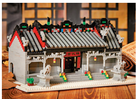
▲廣東民間工藝博物館的陳家祠積木。

「讓文物活起來」「把博物館帶回家」，最好的方式莫過於文創產品。廣東各地博物館近年不斷推陳出新，文具、服飾、擺件、玩具等諸多生活創意類文創產品相繼湧現，文創雪糕、醒獅食品等更