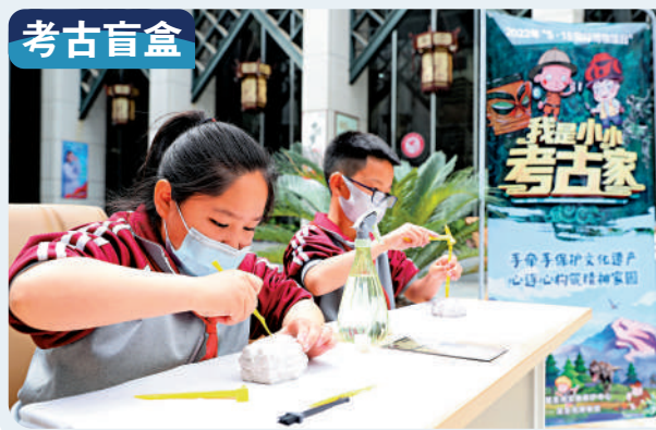
▲5月18日，寧夏的學生們在吳忠博物館內體驗考古盲盒。