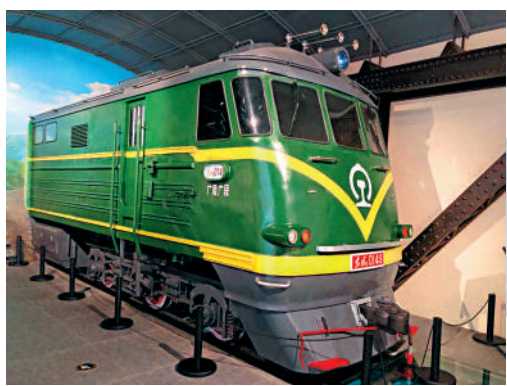
▲廣九直通車的老火車頭。