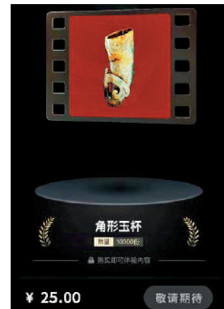
▲南越王博物院的角形玉杯數字文創。