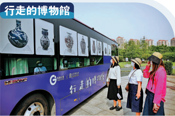
▲天津博物館與天津公交集團聯合推出的「行走的博物館」主題公交車。