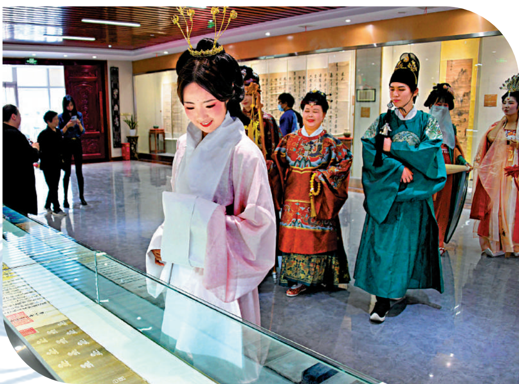
▲近年來各地博物館不斷推陳出新，吸引觀眾打卡。圖為5月18日，漢服愛好者在山東青島海右博物館內參觀。