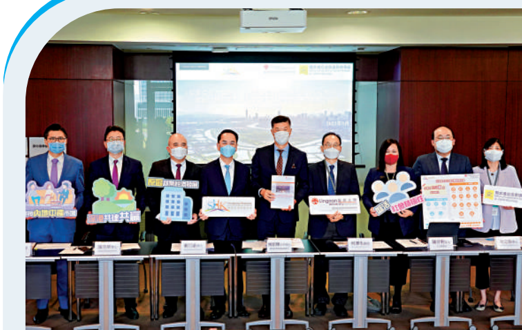
▲滬港經濟發展協會、嶺南大學潘蘇通滬港經濟政策研究所公布新界北居民對北都發展的調查結果。