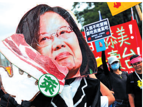
▲台灣民眾舉行集會，批評蔡英文政績不彰。資料圖片

蔡英文的兩岸政策也為人詬病。她上台6年來拒不承認「九二共識」，在「台獨」的死路上狂奔，還通過所謂「反滲透法」等對兩岸各項交流大肆打壓，導致台海局勢緊張。