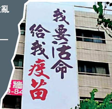
▲台當局防疫亂象頻生，去年缺疫苗，今年則缺快測包。資料圖片

【大公報訊】綜合中新社及台媒報導：台灣地區19日報告新增90378例新冠肺炎確診病例，新增59例死亡病例。醫療衛生專家擔憂，現階段全台灣醫療體系正承受重大考驗，且資源已不足。尤其台中市目前有30多個機構發生群聚感染，一家醫院甚至全院確診。台中市衛生局稱，該機構約有60多人確診，衛生局除緊急給予足夠的抗病毒藥，也調派防疫醫師協助控制疫情。