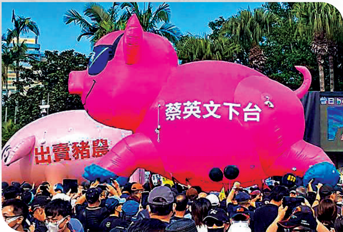
▲民進黨當局領導人蔡英文上台6年，多項重要政策違背民意。圖為台灣民眾舉行集會反對台當局強行進口美國瘦肉精豬肉。

5月20日是民進黨當局領導人蔡英文上台執政6周年。雖然民進黨當局極力宣傳所謂「政績」，但連日來島內政壇和台灣民眾已經紛紛為蔡當局的政治算起總賬。國民黨主席朱立倫批評蔡當局執政6年來有「十缺十亂」。民眾也批評蔡英文執政不彰，尤其是防疫不力，影響民生經濟。台灣民眾則批評民進黨上台這幾年，只顧搞意識形態，破壞兩岸關係，導致台海緊張，對於民生方面漠不關心，以致島內疫情失控。此外，這幾年島內物價飛漲、停電限水，也令台灣民眾相當不滿。